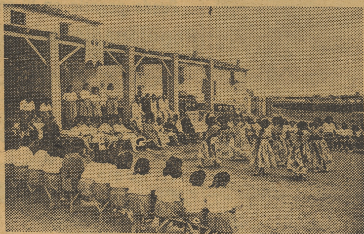
Con asistencia del Jefe provincial y Gobernador civil, se celebró ayer, en Calpe, la clausura del albergue universitario «Daniel Molerés».

CLAUSURA DEL ALBERGUE UNIVERSITARIO DE CALPE