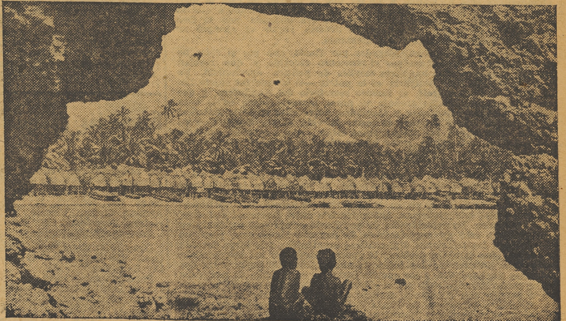
Un poblado papua del interior