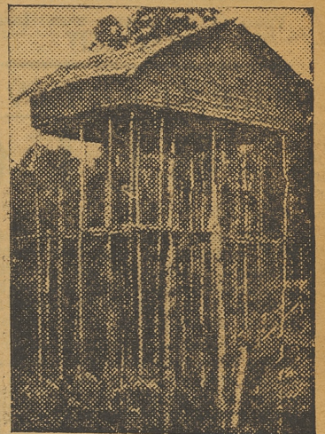
Una casa aérea de los pirmeos de Nueva Guinea. Su altura es de 15 metros sobre el nivel del suelo