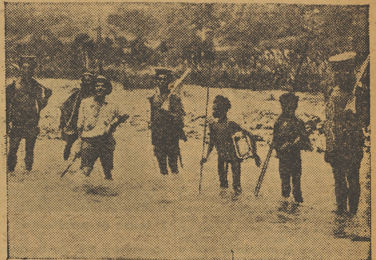
Una expedición de policías indígenas atraviesa el río de Markham