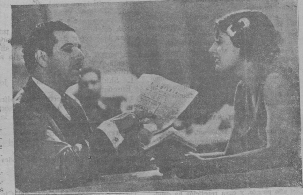
Nuestro paisano Fortunio Bonanova, impresionando la película "Alegre voy"