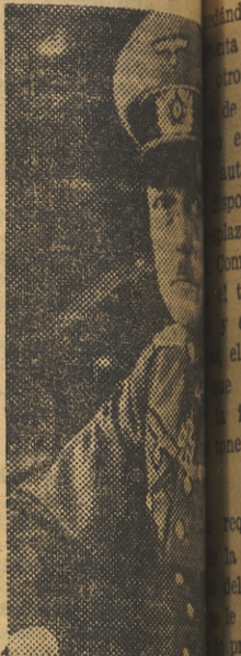
El mariscal von manda las fuerzas han de oponer

Considerada en sus momentos finales la fase preparatoria de la destrucción e inutilización de los objetivos industriales y de los nodos de comunicaciones por medio de los bombardeos, así como la neutralización de la defensa antisubmarina, el acoso o asedio formal parece inminente. Hay quien cree que esta fase, inmediatamente previa al asalto, tendrá la característica de un bombardeo aeronaval tan intensamente destructor y concentrado que haría, por sí solo, saltar hecho astillas todo el sistema defensivo alemán. Nada más lejos de la realidad. Si esto fuera así por la estrecha faja de terreno que hay que suponer objeto del ataque, los demás medios de las fuerzas aliadas no podrían discurrir y los baluartes interiores y la masa de reserva alemana