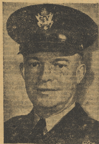
El mariscal Dwight Eisenhower, comandante jefe del Cuerpo expedicionario aliado

En la maniobra cula que los aliados millón de hombra para la invasión