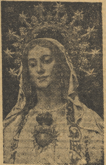
Imagen para el nuevo altar de la iglesia de la Compañía

Por fin, la devota Asociación de la «Pia Unión de los Sagrados Corazones de Jesús y de María», establecida canónicamente en la hermosa iglesia de la Compañía, ha visto realizados sus laudables de-