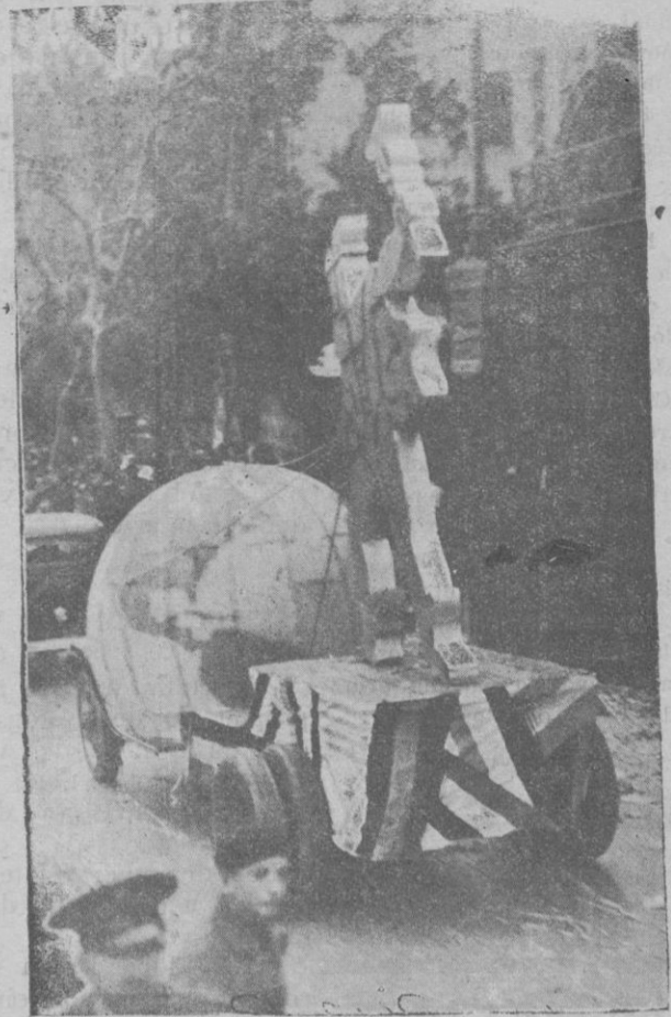
La carroza de la Unión Protectora Mercantil.

"Prefiero recoger la realidad actual, con todos sus defectos y por mala que sea, y transformarla, porque estoy seguro de