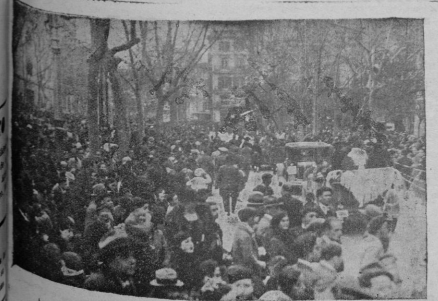
Animadísimo aspecto que ofrecía la rúa en el paseo del Borne.