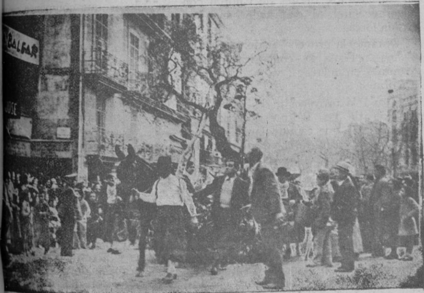
La carroza del Paralo de Valldemosa.

que es una ley defectuosa aquella que coacciona, que merma las fuerzas del Poder ejecutivo en nombre del cuerpo electoral. Yo creo que esta ley debe ser reformada, y en días de reforma estamos. El Estado debe ser fuerte, y para ello tiene con los actuales medios más que suficientes para lograrlo. Los medios coactivos que posee son suficientes para conseguirlo, y los medios de fuerza también, incluso, a mi juicio, excesivos.