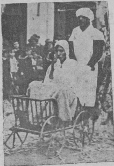
Uno de los mascarones que llamó la atención.

Sería una prueba peligrosa, un salto en lo desconocido que podría acarrear que las derechas fuesen barridas de la gobernación del país, lo que representaría el auge del marxismo; ya que ahora en el mundo la lucha se entabla entre marxistas y anti-marxistas.