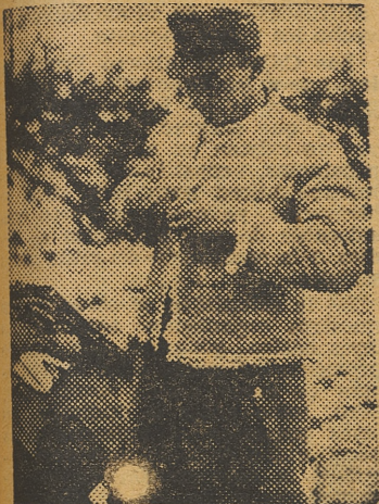
Los soldados alemanes disponen este invierno de magníficos equipos contra el frío. La fotografía muestra uno de los chalecos especiales del equipo.