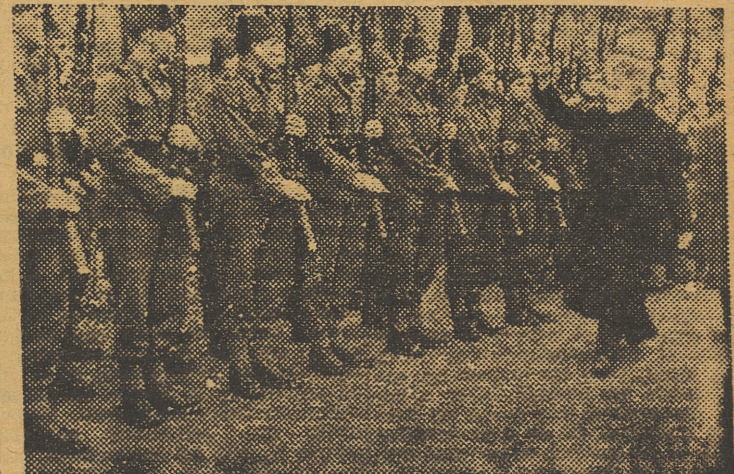
El Gran Muftí de Jerusalén, pasa revista a los voluntarios musulmanes.