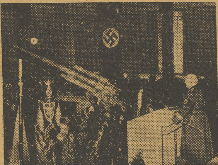
En una fábrica de armamento del Reich, el jefe del Estado Mayor de la S. A., pronuncia un discurso exhortando a los obreros a aumentar la capacidad de producción y reiterando la fe en la victoria alemana.

"Nuestro Movimiento ha de demostrar su capacidad y su lozanía para renovarse y transformarse de día en día"