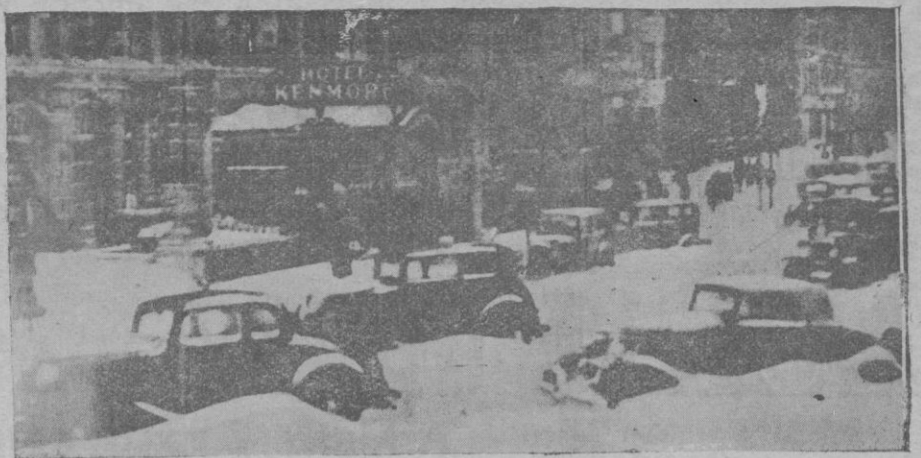
Bajo el imperio de la nieve. — He aquí el aspecto de una calle de Boston, en la cual, los autos quedaron medio sepultados

Polonia, apenas constituida, mal soldados aún los fragmentos de la vieja patria histórica, rusos prusianos o austriacos durante siglos, sin fuerzas militares casi, es tuvo a punto de sucumbir. Sus fronteras fueron violadas. Las ciudades del Norte y del Este, ocupadas por el invasor. Mientras Budienny, con su caballería velocísima, penetraba en Galitzia y se acercaba a Lemberg, Tukachewsky, siguiendo las huellas de Paskiewicz, desbordaba la línea del