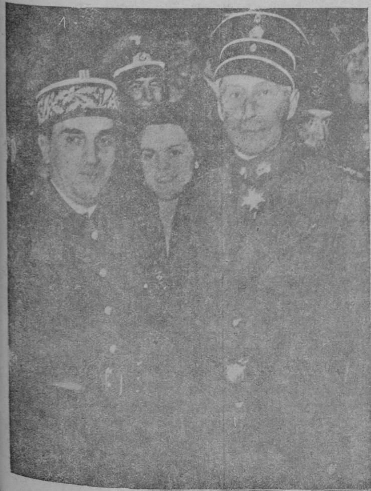
El general francés Laurence fotografiado con el ex-croprínz en Berlín. — La primera fotografía obtenida desde la guerra de representantes de dos países que se odiaron y ahora por fortuna van reconciliándose