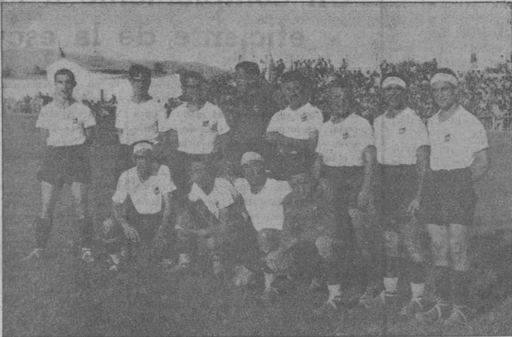
El "Constancia F. C.", campeón de Mallorca, que esta tarde con motivo de la repartición de premios celebrará un partido contra una selección de primera categoría