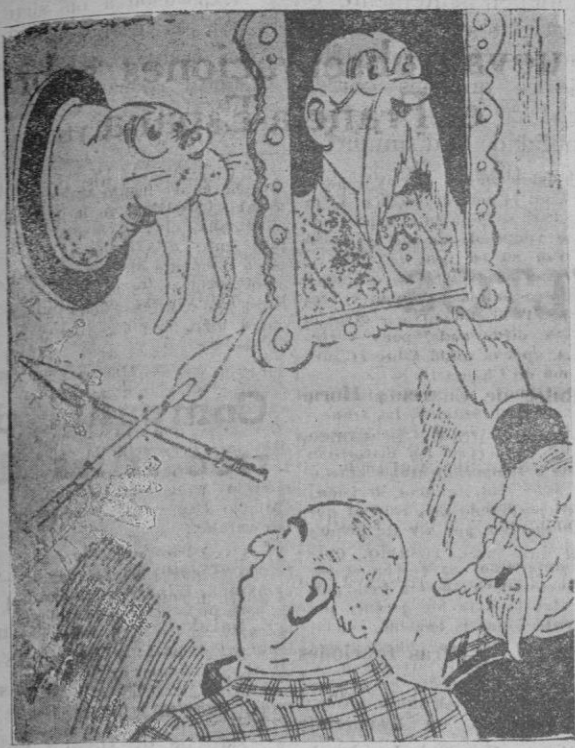
—No; éste es mi bisabuelo.