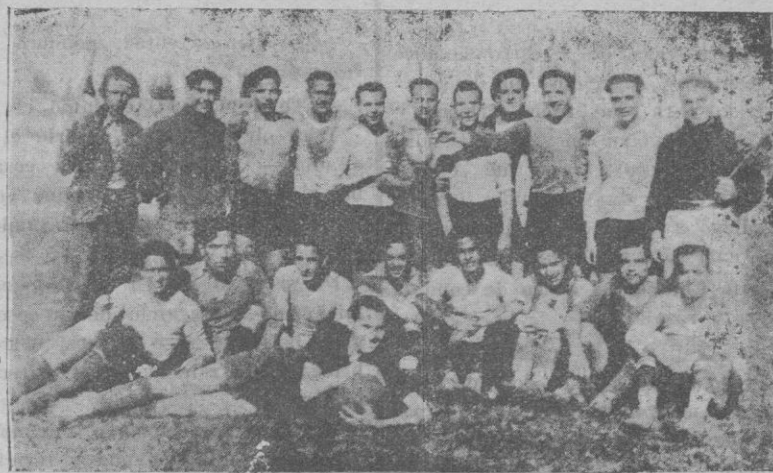
Grupo de jugadores que tomaron parte en el partido de despedida al jugador del C. D. Mallorca, Gomila