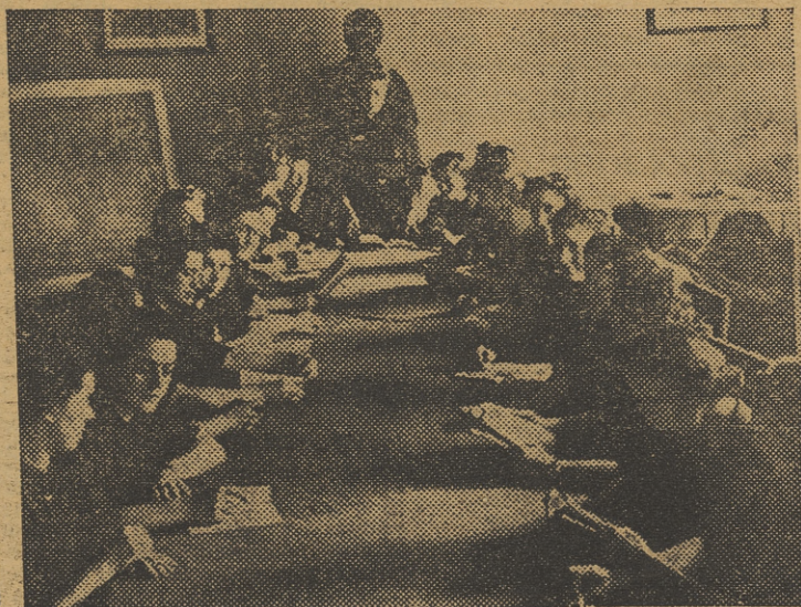
Las nuevas enfermeras de la Falange que van a relevar a las que están prestando sus servicios en el frente ruso, asisten a la última clase días antes de la partida