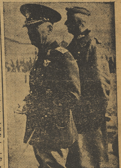
El general von Manstein, jefe de las fuerzas alemanas en Kerch, con el mariscal Antonescu