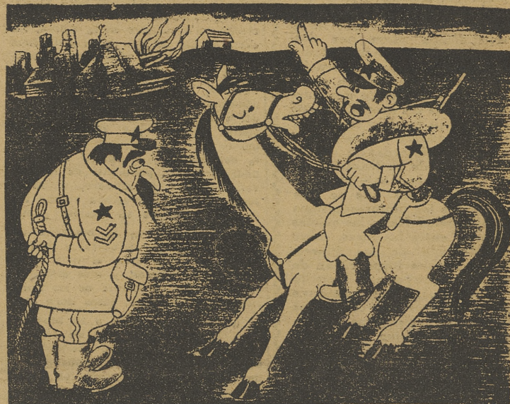
—¡General, alerta! Creo que los alemanes se proponen atacar Dantzig.

ciudad muy importante desde el punto de vista de las comunicaciones; es decir, una ciudad de gran significación para el desarrollo de futuras operaciones. La aviación del general Ritter von Greim ha contribuido eficazmente a las operaciones.