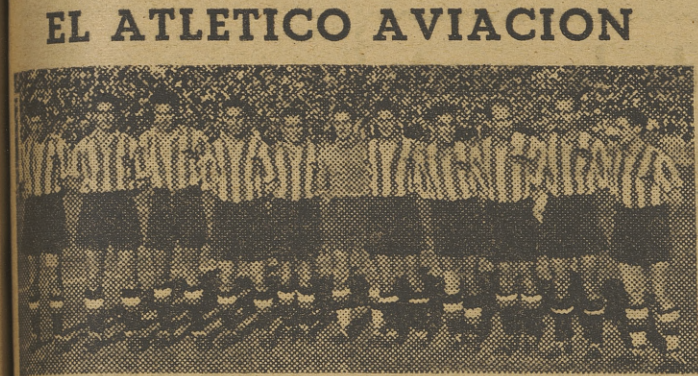
Equipo de los campeones de Liga, vencido ayer por la técnica de los jugadores alemanes y por el fracaso del eje de su ataque