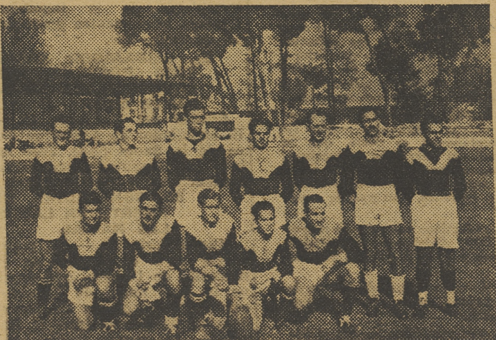
Equipo de rugby del S. E. U. que, en el festival deportivo del domingo, derrotó a la Selección Valenciana.