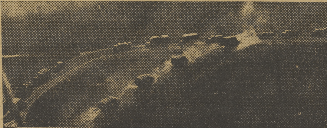
Largas hileras de camiones llevan al frente las municiones y los víveres de las tropas del Reich