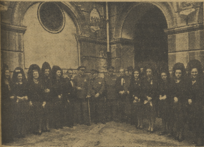
Autoridades militares y señoritas que presidieron los actos en honor de Santa Cecilia, esta mañana, en la iglesia del Milagro.