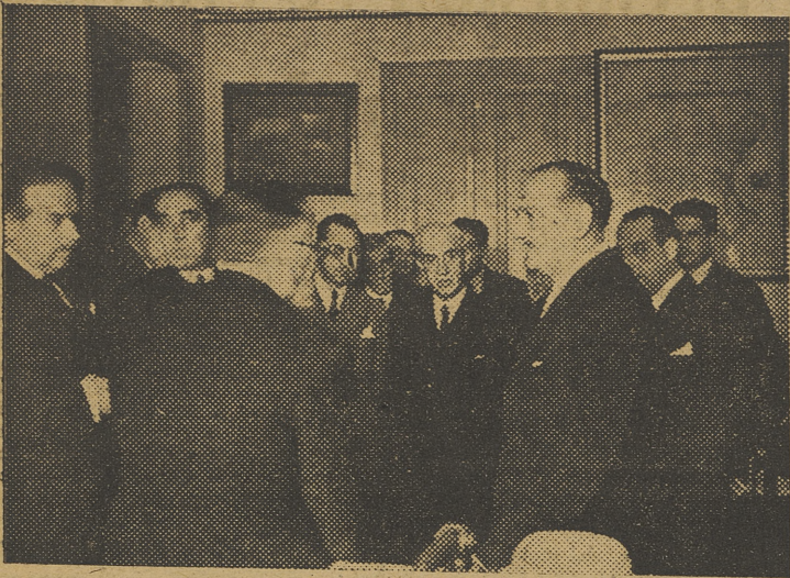
El Ministro de Obras Públicas, en su visita a la Confederación Hidráulica del Júcar.

El Ministro de Obras Públicas, en Valencia