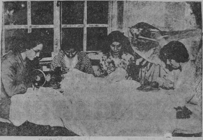
Las cuatro alumnas más destacadas de la Escuela Real Británica de costureras, en Londres, se ocupan en bordar una colcha que regalarán a la princesa Marina, la futura esposa del príncipe Jorge de Inglaterra.