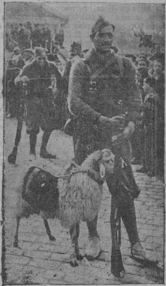
Las fuerzas del Tercio que actuaron en la pacificación de Asturias a su llegada al Ferrol. — En primer término la "mascota" de la Legión

aquella hermosa Catedral que es admiración de cuantos la visitan. Con información apenas superable, el más octogenario Pastor ha podido probar, con innegables hechos, que en todo lo ocurrido, y que semeja cruel pesadilla, "lo que destaca y se manifiesta más claramente es el odio a la Iglesia y sus ministros. Persiguen, despojan de todo y asesinan tan bárbaramente a estos Curas, por ser Sacerdotes, ministros de Dios; y a los soldados, y demás, por ser defensores de la Patria. Unos y otros han sucumbido, muriendo gloriosamente como mártires de la Religión y de la Patria". Unos y otros han sucumbido, muriendo gloriosamente como mártires de la Religión y de la Patria". Y después de entrar en pormenores que conmueven hondamente por el refinamiento de maldad que suponen y revelan volviendo la vista del espíritu a las víctimas de esa explosión de odio ante la cual palidece el que produjo millones de mártires de nuestra Fe, escribe estas caritativas palabras: "Postrémonos reverentes ante sus venerandos restos, pidiendo por su eterno descanso, y honremos su memoria a todas luces merecedora de profunda y cordial veneración.