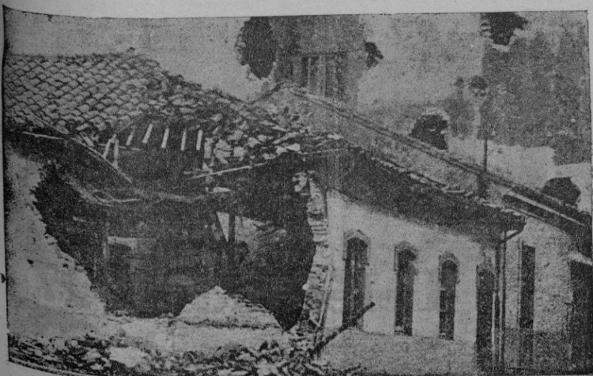
El barrio de Cimadevilla, en Gijón, que se hallaba en poder de los revolucionarios, y fué bombardeado desde el crucero "Libertad"