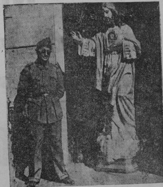
Image del Sagrado Corazón de Jesús que se conservaba en la iglesia de Bembibre, y que los revoltosos, porque el color de la túnica y del corazón es rojo, le sacaron de la iglesia y la colocaron en mitad de la plaza, donde aparece fotografiada, para que no la destruyera el fuego. En ella pusieron un letrero en el que se leía: "Cristón rojo. A tí no te hacemos daño porque eres de los nuestros"

Había mucha inquietud por conocer la situación de este señor, de quien se dijo en los primeros momentos que había sido capturado por los rebeldes.