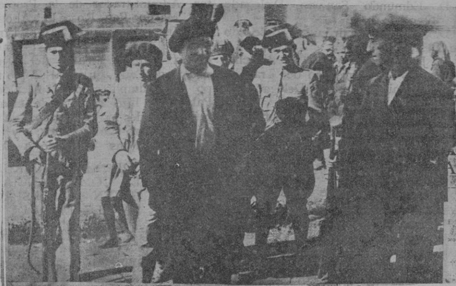
Los primeros detenidos en Oviedo conducidos por la fuerza pública

Renunció a la política; se le quiso hacer ministro y rehusó; recibió gran número de distinciones honoríficas, que recibió con una sonrisa sutil y decidida. Y escribió mucho, mucho; trenzando los frios trabajos de investigación con fecundas máximas morales y profundas filosofías. De su carácter entero da una prueba elocuente el juicio que formó sobre el Premio Nobel que se le concediera, con otras derivaciones de recia filosofía: "Al recibir el Premio Nobel experimenté tres sentimientos: 1.º De gratitud cordial al Instituto Carolino por haber pensado en premiar mi modesta labor científica, A LA CUAL JAMAS CONCEDI IMPORTANCIA, 2.º De inquietud recelosa, al ver que muchos investigadores, adornados con más relevantes méritos que yo, quedaron postergados, y por consiguiente heridos en su orgullo. VARIOS de ellos, como yo prevenía de entusiastas amigos o émulo benévolo, SE CONVIRTIERON EN AGRIOS ADVERSARIOS. 3.º De admiración y extrañeza al advertir que dicho Instituto, desoyendo los requerimientos del patriotismo, había olvidado a varios anatómicos e histólogos suecos, entre ellos el incomparable profesor G. Retzius, a quien siempre consideré como mi maestro y cuya obra anatómica e histológica es una de las más serias, valiosas y considerables que existen. Más tarde, fallecido el gran investigador, CORROBORE por carta de su inextinguible viuda, el viejo adagio de que NADIE ES PROFETA EN SU TIERRA". Rezu-