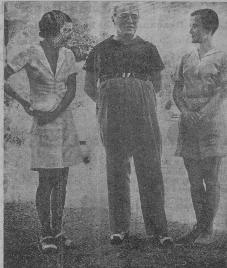
"A B C" ha publicado esta fotografía del veraneo en Formentor. Se trata del ministro francés M. Sarraut, con la princesa de Sherbatov y la marquesa de Fontjoyese. La fotografía es de Urbani, y la reproducimos a título de curiosidad.