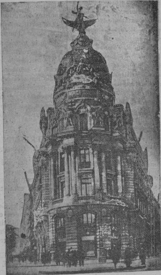
PALACIO DE LA COMPAÑIA EN MADRID