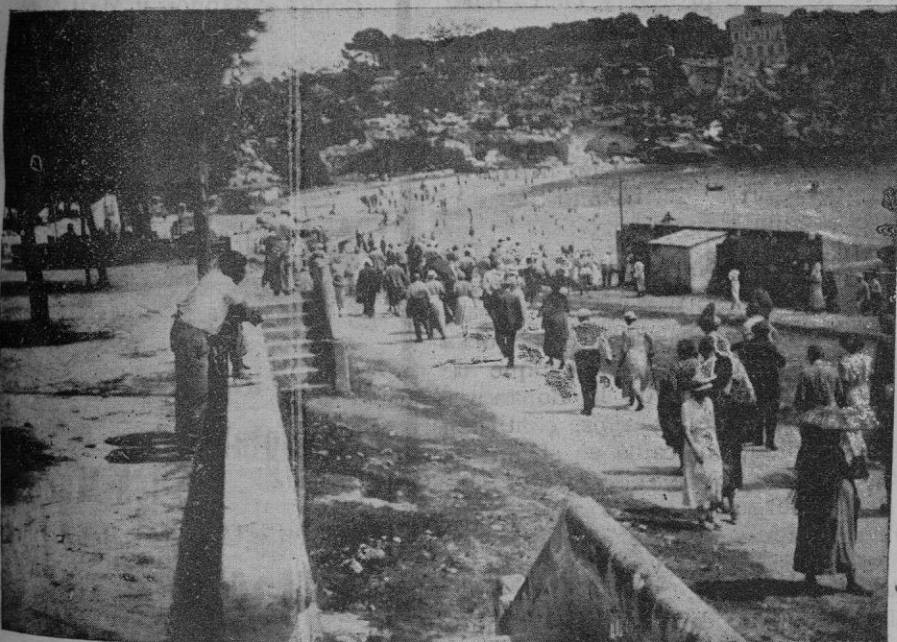
Los excursionistas de "El Día Gráfico" en el puerto de Manacor