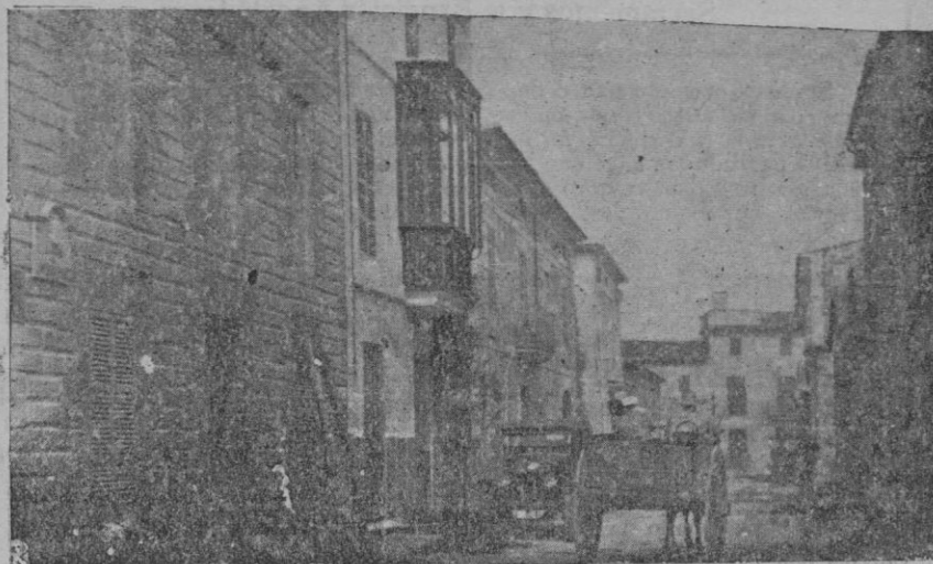
La calle del "Mestre Mas" después de haber sido descubierta la lápida.

Por la tarde, después del descubrimiento