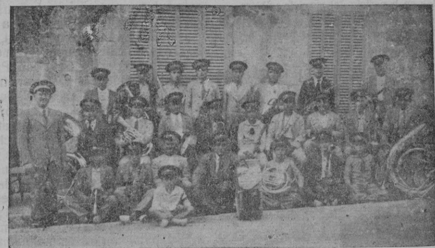
La banda de música de San Juan, que tomó parte en la fiesta dedicada al "Mestre Mas".