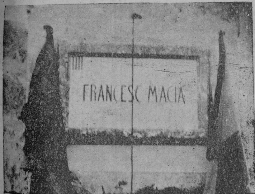
La lápida de la calle dedicada a Francisco Maciá, descubierta el sábado.