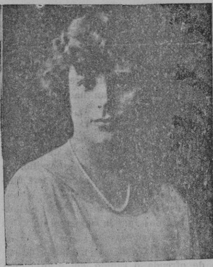
La ex-infanta Beatriz, de la que se dice que va a ingresar en un convento

rará a la amortización de dichos títulos por sorteos anuales.