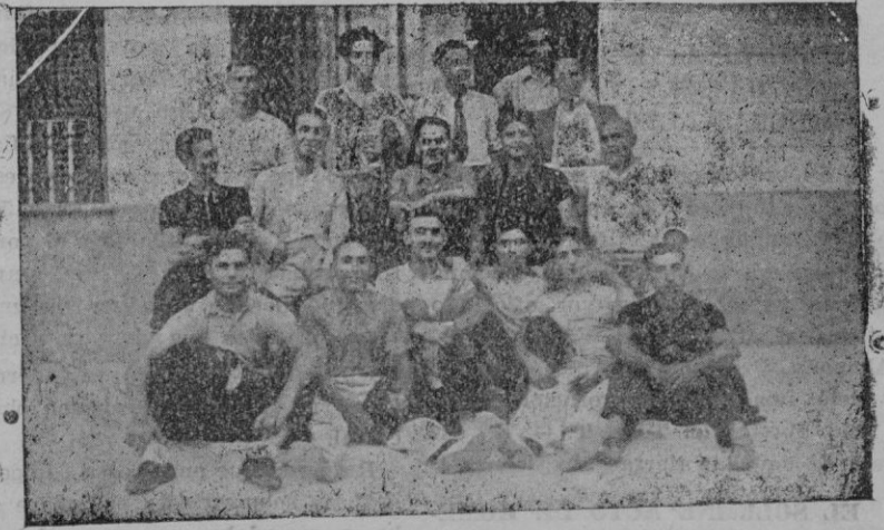
En fraternal camaradería los corredores que han tomado parte en las distintas pruebas celebradas en Mallorca con los directivos de la Peña Nicolau y Club Ciclista Pollensa con el empresario y manager de los mismos

Y añado la leyenda californiana que al bendecir por última vez a California, deseó Junípero Serra ceder cien Misas para que la bendición fuera completa. Ni una Misa siquiera pudo celebrar el Santo Misionero, que muy luego fué a descansar en el Señor. Pero Dios, según reza la leyenda, le