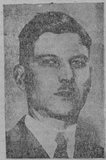
El canceller austriaco, señor Schuschnigg, que, en Florencia, se ha entrevistado con el señor Mussolini