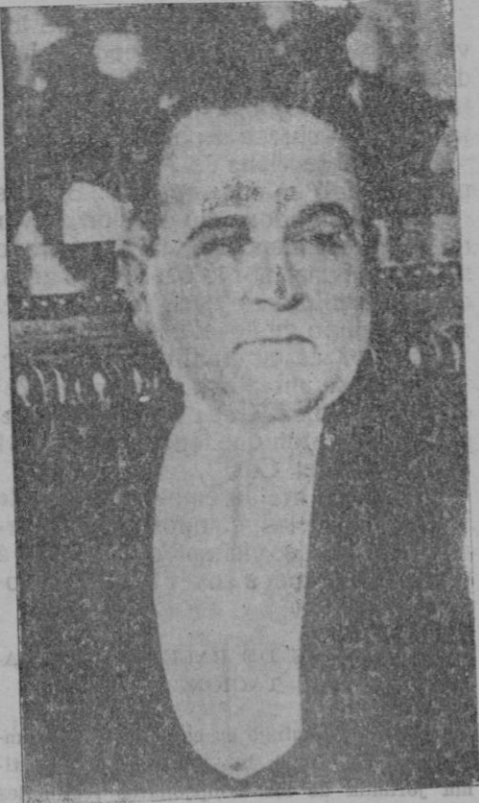
Don Getulio Vargas, que ha sido elegido Presidente del Brasil

quienes, a pesar de su esfuerzo, de su buena voluntad y hasta de su valía, ven desarrollarse su existencia en un ambiente cerrado a toda mejora y a todo porvenir más brillante que, por lo menos, asegurara una vejez tranquila. Por regla general, al enfocarse los problemas de las necesidades del individuo se enfocan únicamente bajo el punto de vista de mejora del obrero manual. Sociólogos y políticos, al levantar su bandera, ante las masas han de ostentar en su programa, y hasta casi como punto básico de la reforma por que propugnan, la mejora moral y económica del proletariado. Postura muy humana y muy justa que hemos defendido siempre. Pero se descuidó por completo un sector muy importante de la Sociedad: el de la clase media que hoy sufre gravemente las embestidas entre los de arriba y los de abajo; que ha visto como la vida aumentaba su coste sin que los ingresos sufrieran la correspondiente modificación. El conflicto estriba en que por cada plaza vacante existen docenas de aspirantes, cuyo número se reducirá notablemente con las disposiciones del Ministro de Hacienda, las cuales substraerán del paro forzoso a buen número de individuos que anhelosamente buscan hoy colocación, que les permita vivir y no la encuentran.