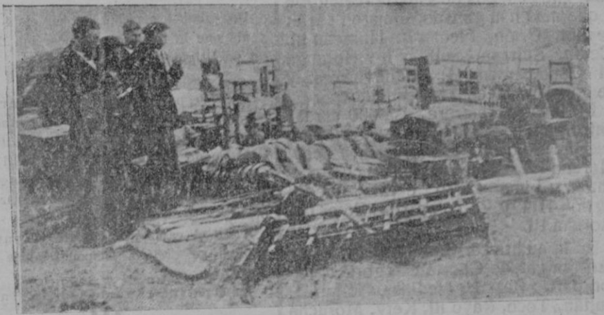
Un formidable incendio ha destruido en breves horas gran parte del pueblo de Císla. Restos del escabísimo mobiliario que pudo salvarse del siniestro

el apetito. Anoche cenó copiosamente y durante toda la tarde estuvo libando bebidas frescas, especialmente cerveza, y fumando cigarrillo tras cigarrillo.