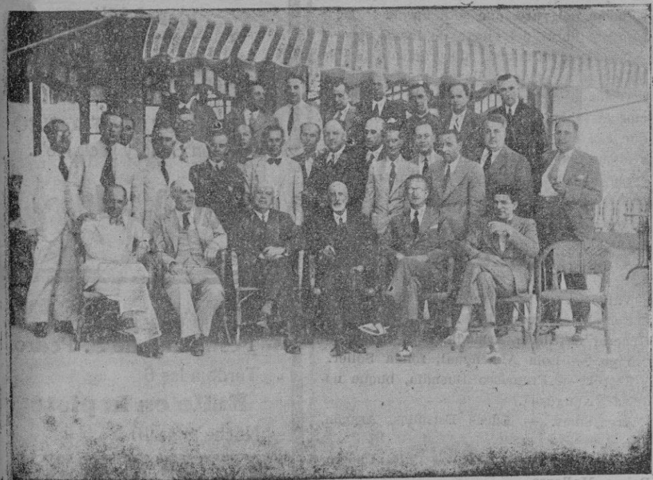
Los estudiantes que terminaron el bachillerato en 1909, reunidos en fraternal banquete, con sus catedráticos, para solemnizar sus Bodas de plata.

Y aún pedimos más, la Escuela Granja, que vendría a constituir un internado para