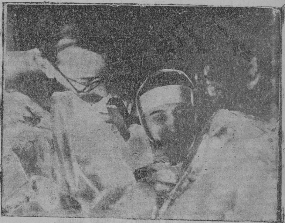
Este hombre ha permanecido, para un experimento científico, 20 días dentro de un bloque de hielo. — Momento en que uno de los médicos rompe con un martillo el bloque de hielo. El sujeto sometido al experimento estaba en estado catáptico.

La Sala dictó sentencia absolviendo libremente al procesado, declarando las costas de oficio.