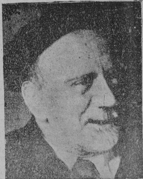
Don Pío Baroja, que ha sido elegido académico de la española

La cosa no parecía presentarse mal para el artista: entusiástica acogida femenina, curiosidad y expectación por parte de los hombres, atención sostenida de la Prensa. En estas condiciones, un viajero que sólo hubiera venido en ese carácter de viajero habría conquistado a Buenos Aires. Pero Ramón Novarro no venía como turista: venía como astro del «cine» que ambicioso de gloria, y no digamos de pesos, quería conquistar al público desde el escenario de un teatro.