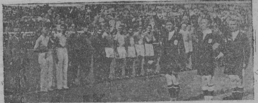
La "squadra azzurra", se ha adjudicado el campeonato mundial, alineada en el estadio de Roma. El árbitro y los jueces saludan a la manera fascista

Per cert que en la discussió d'aquest projecte el darrer dia, dimecres, es feren a la Cambra unes declaracions que cal recollir. El mateix els representants de la minoria socialista que els representants de la minoria popular agrària a la Comissió es planyien que els diputats de Lliga Catalana haguessin demostrat en la defensa dels drets de Catalunya una més gran intransigència que els diputats de l'Esquerra. Deien que quan l'Esquerra havia acceptat ja fórmules de transacció més atenuades, la Lliga imposava solucions més concretes en el sentit autòmic. I seria molt curiós que alguns manifestants barcelonins d'aquests dies llegissin els comentaris que fan «El Socialista», «El Liberal» i altres òrgans periodístics de la política del bienni a l'actitud de Lliga Catalana.