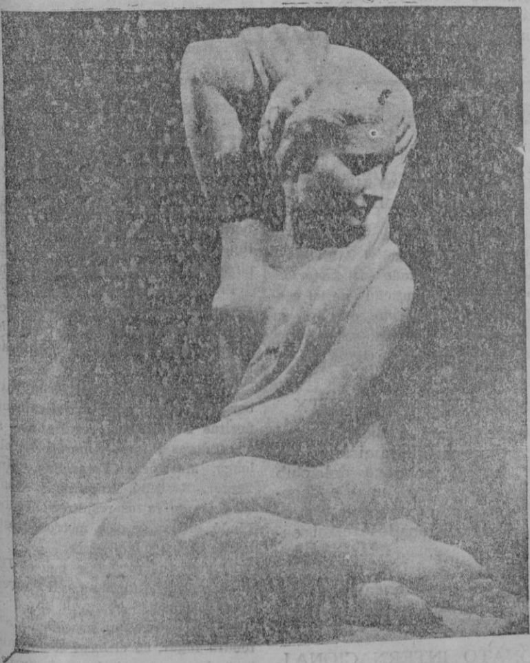
De la Exposición N. de Bellas Artes. — "Eufrosina" escultura en mármol, de nuestro paisano Salvador Adrover, expensionado de la Diputación, que es objeto de elogio por la crítica

Claro está que, esta transformación, no será sin el sacrificio de algo aunque muy nuestro, también muy sevillano, como era, por ejemplo, el atravesar en todas las direcciones la plaza de Corti, los brazos en alto, sorteando las embestidas de los autos, como el banderillero que sortea las astas del toro para dejar en su morrillo un buen par de balaítoques. Sorteado el auto, hasta ahora habíamos dejado a su espalda, un buen par de palabrejas más o menos de grueso calibre. Es un sacrificio que hemos de consumir con el