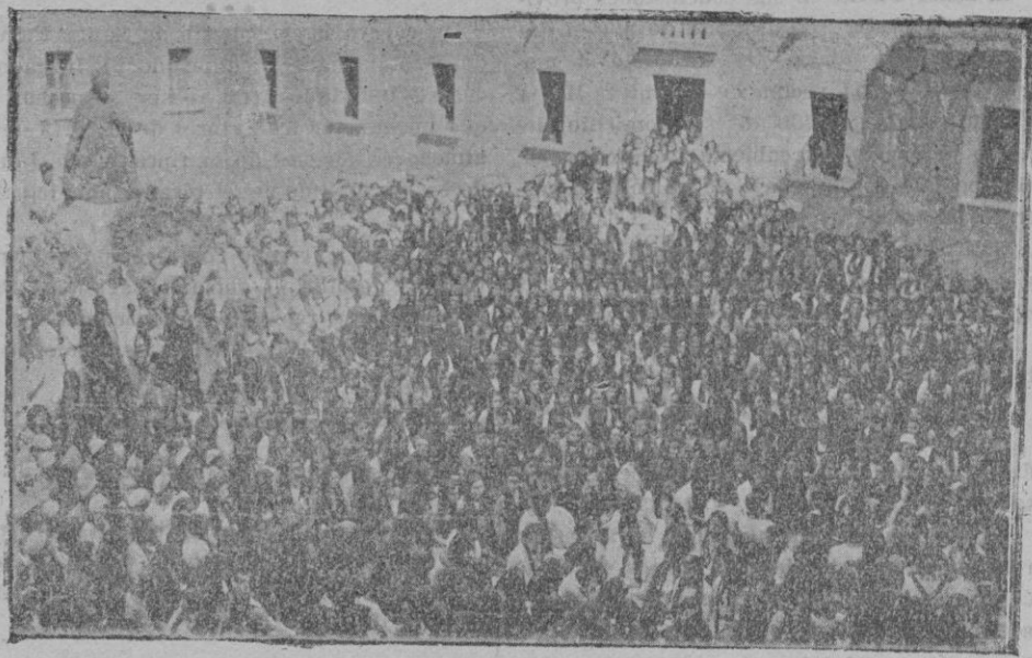
De la Asamblea Católica Femenina en Lluch. — El patio del Santuario durante la celebración de la Misa

A las tres de la tarde reunióse nuevamen-