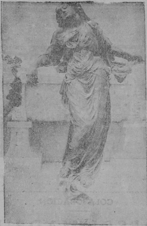
La Tristeza. — Figura para el panteón de la familia Ramis, que será colocada en el cementerio de Alcudia, obra original del escultor Sr. Vila