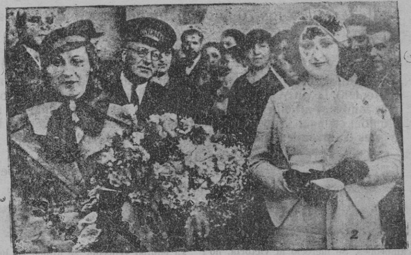
"Miss Cataluña" (1) y "Miss Balcáres" (2), que salieron para Madrid, con objeto de participar en el concurso organizado por "Ahora"

De los palitroqueros: nuestro paisano Va-