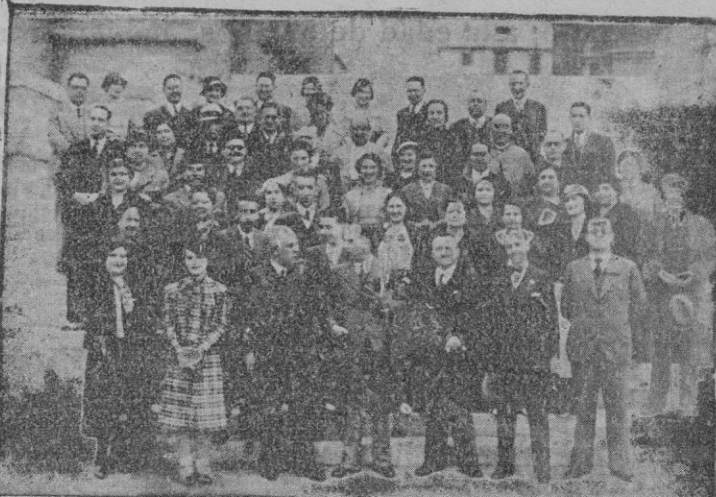
Llegada a Palma de la excursión organizada por el Centro Excursionista de la comarca de Buges, importante entidad establecida en Manresa, que serán nuestros huéspedes durante unos cuantos días.

Pero Odette seguía convencida de su indignidad. —No intentes disculparme—prosiguió—; soy una egoísta una miserable egoísta, que sólo pienso en las cosas que a mí me agradan y no me acuerdo de tí para nada. Pero yo te aseguro que no volverá a ocurrir. Te lo jura tu mujercita. Y, en efecto, al día siguiente, cuando Santiago entró en su casa, Odette se arrojó cariñosa en sus brazos, y comiéndoselo a besos le dijo: —Ven pronto, querido. Verás qué sorpresa te he preparado. Mira, ¿para quién ha comprado Odette esta pitillera de pa'a tan bonita? Con los cigarrillos que te gustan y todo. ¿Estás contento? Hoy no dirás que tu mujer es una egoísta, que sólo piensa en ella. Pero será preciso, querido, que me des doscientos francos para pagar al joyero que me ha vendido la pitillera. ¿Verdad que hoy estás muy contento y orgulloso de tener una mujercita como yo?