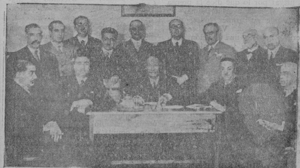
La comisión ejecutiva del Partido radical en la memorable reunión en la que se separaron del partido Martínez Barrio y sus amigos