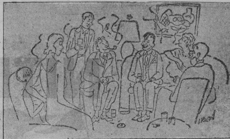
—Voy a cantarles una canción en el idioma de mi país, una canción japonesa. Pero les prevengo que es un poco escabrosa...

ños y niñas de los Catecismos del Arciprestazgo de Palma tendrá lugar el próximo domingo día 20 en el Salón de Actos del Palacio Episcopal, a las cuatro de la tarde.