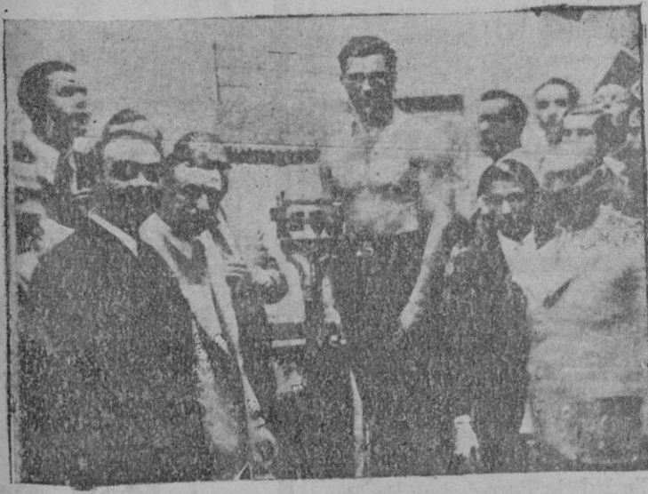
El match Uzunum - Schmeling. — Momento de pesar a los boxeadores