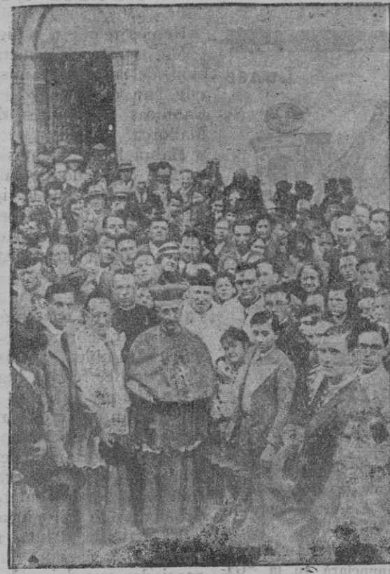
El nuevo obispo de Gerona, rodeado de los fieles de su diócesis, saliendo de la iglesia catedral.