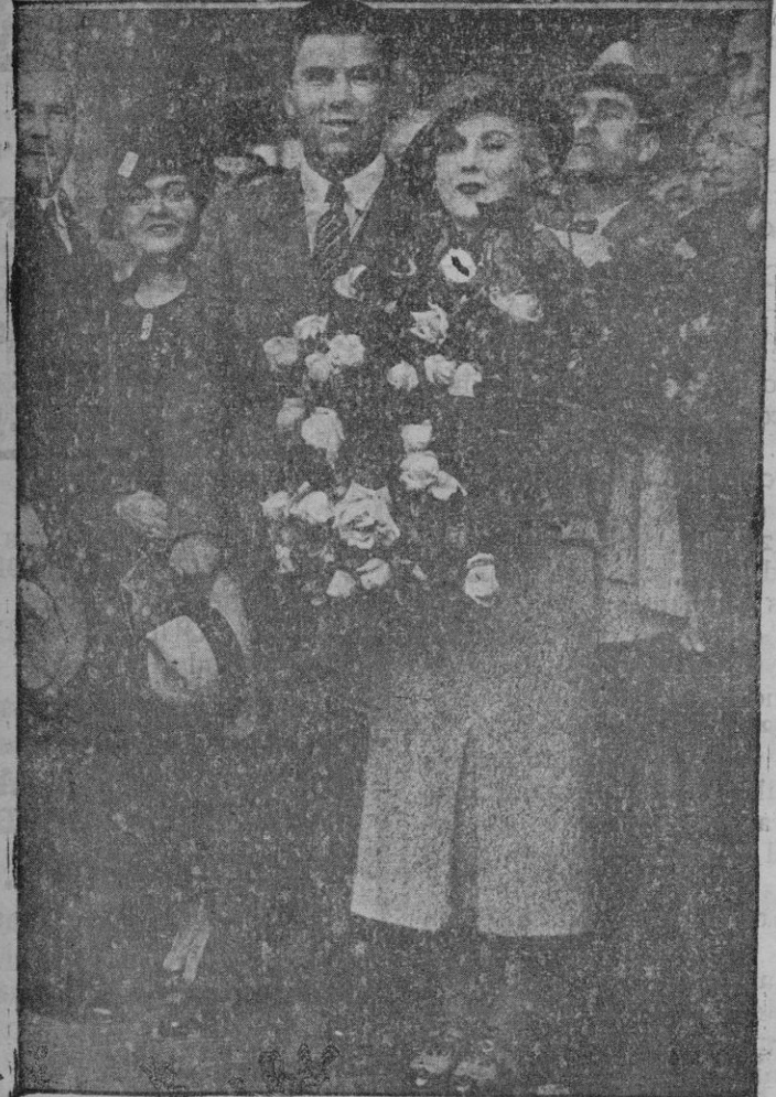
Procedente de París y acompañada de su esposo, el célebre boxeador Max Schmeling llegó a Barcelona la "star" cinematográfica Amy Ondra

El Gobernador ha impuesto una multa de doscientas cincuenta pesetas al dueño de un café de Manacor, por denuncia de que se jugaba a los prohibidos en dicho establecimiento. También han sido multados con doscientas cincuenta pesetas el dueño de un café de Binisalem y con veinticinco pesetas cada uno de los diez jugadores, denunciados todos por el Alcalde de aquel pueblo, por jugar a los prohibidos. En caso de resultar insolventes cualquiera de los multados, deberán sufrir el arresto supletorio.