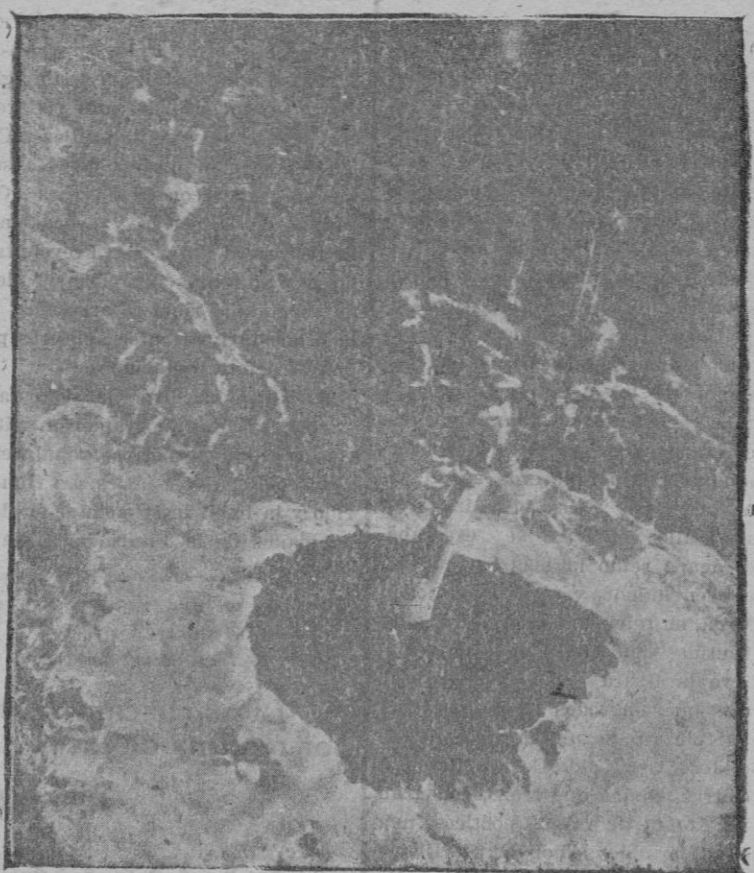
El faro inglés de Hearteoch, en el cual el guardián ha permanecido aislado del mundo durante diez días, a causa de las temporales.