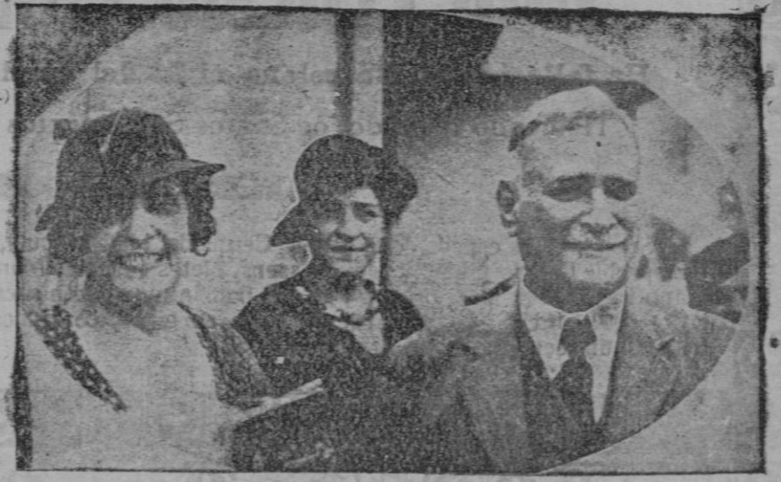
El nuevo Presidente de Cuba don Alejandro Mendieta, con su esposa

El local, en óptimas condiciones de higiene, está dotado de material suficiente, tanto en lo que respecta a los métodos de tratamiento, como a los de diagnóstico y pronóstico. Posee este Dispensario una consignación para la adquisición de medicamentos que cubre las necesidades del mismo, contando por lo tanto con todo lo considerado en la actualidad necesario al tratamiento: Crisoterapia, calcoterapia, tuberculoterapia, etc. Efectuándose también en el Dispensario el tratamiento ambulatorio por colapsoterapia, mediante el neumotórax artificial. El diagnóstico es facilitado por un gabinete radiológico, dotado de un aparato de Rayos X Hellodor, de una válvula, mesa clinoscopio con un tubo protegido Multix, de 150 mA., que permite un completo examen radioscópico y radiológico del enfermo; anexo al gabinete hay una cámara oscura para el revelado de los films radiográficos impresionados; este servicio está a cargo de un técnico fotográfico. El Laboratorio, que ocupa una amplia estancia en