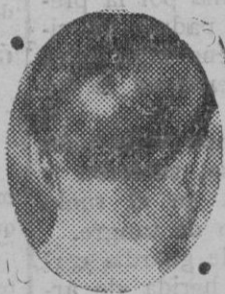
5 años enfermo

De 1927 a la fecha, más de 10.000 casos curados Asombroso y creciente éxito del tratamiento J. MOURADE