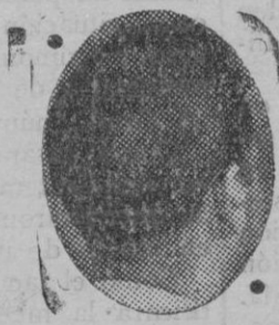
3 meses tratamiento