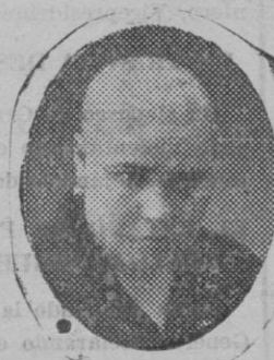
14 años enfermo

A los numerosos casos de curaciones de calvicies desde el mes de Mayo que funciona la clínica en Palma, hoy se presentan nuevos casos de curados de personas de esta capital.