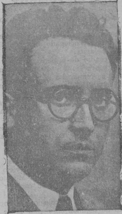
Don Juan Selvas, nombrado gobernador general de Cataluña

He aquí ahora la escena. Estamos en agosto, en la elegante playa de Villebín. Son las once de la mañana. Rosina, que es la mamá de Pouic, está en su cuarto de baño haciéndose las cejas, delicada operación durante la cual la mujer más charlatana permanece milagrosamente muda. Está ante el espejo, y de pronto ve en la luna como su pequeño Pouic abre