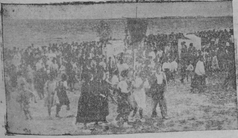
La promesa de la Virgen del Carmen, patrona de Isla Cristina (Huelva), en la barriada de pescadores

y otro va a pie al lado del borrico. Es demasiado, ¿verdad? La institutriz ha dado un franco al chiquillo andrajoso. Pouic ha subido al cochecito, y se alejan uno sentado y otro a pie. «Mademoiselle» ha vuelto a reunirse con las otras institutrices, y Máximo y Rosina se acercan al co-