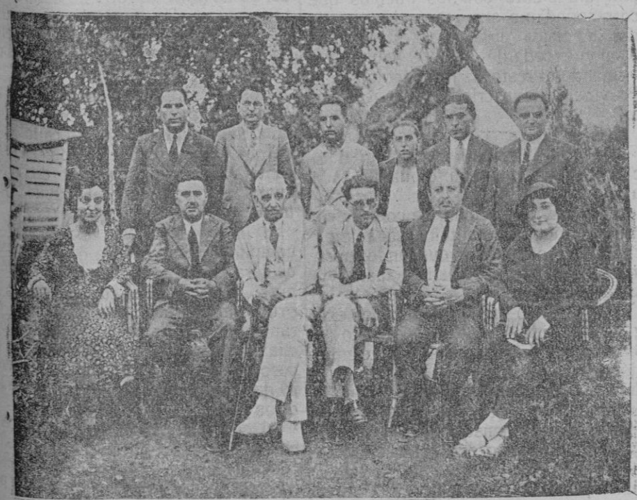
Grupo de nuevos Peitos Avícolas de la Escuela Nacional de Avicultura de Consejo.—Sentados el tribunal de los exámenes y las señoritas que han seguido el curso