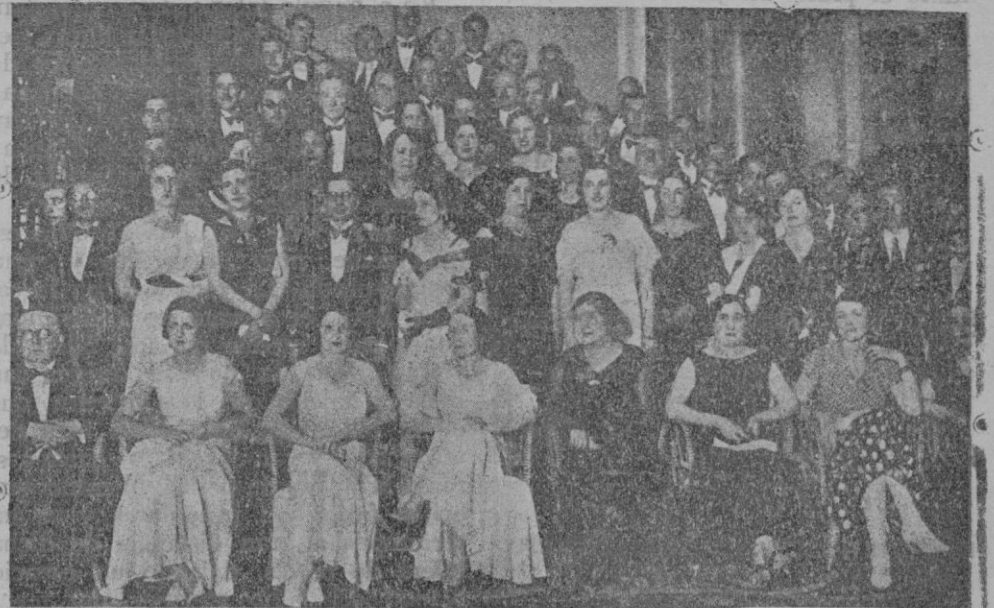
Del Congreso de Odontología.—Concurrentes al banquete con que los congresistas españoles obsequiaron a los extranjeros

Bromatología Higiénica, 304; Productos patológicos, 168; Agua de la Fuente de la Villa, 21; Depósitos públicos y particulares, 26; Total de análisis, 519.