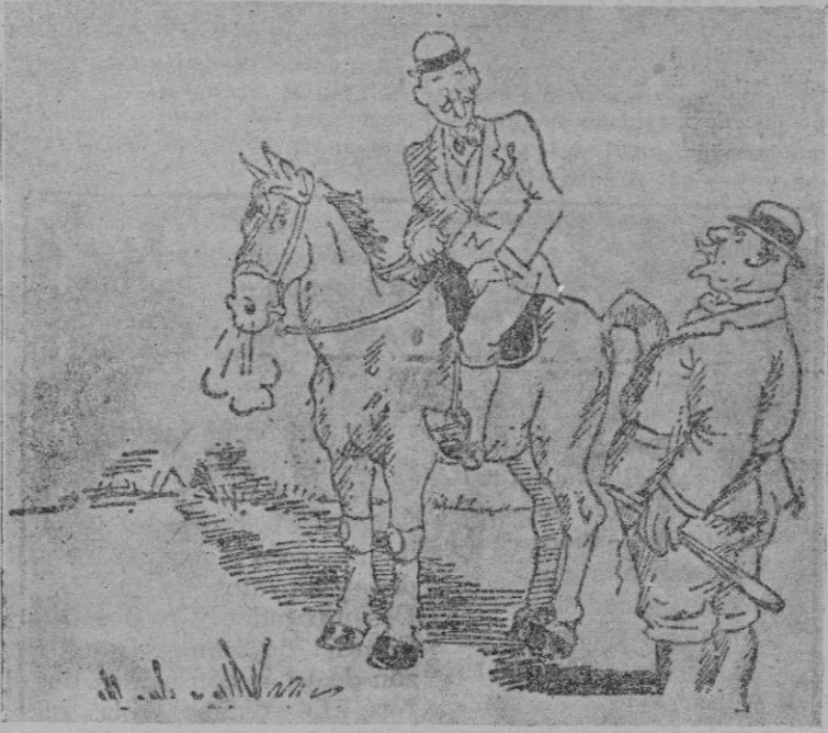
—La costumbre es pagarme por adelantado el alquiler del caballo. —¿Teme usted que vueva sin el caballo? —No; pero el caballo pudiera volver sin usted. (De "Rie et Rac", de Paris)

ha impuesto a la referida dueña la multa de 250 pesetas, habiendo ordenado el cierre por un plazo indefinido del referido establecimiento.