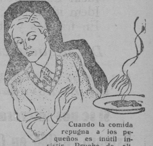
Quando la comida repugna a los pequeños es inútil insistir. Pruebe de alimentarlos con

La «Gaceta» publica la orden, disponiendo que en el plazo de 20 días se verifiquen elecciones para designar seis vocales efectivos y seis suplentes de cada representación que integran el Jurado Mixto de Obras públicas de Palma de Mallorca.