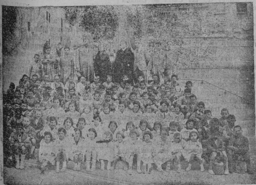
Niños y niñas de Santa María y Santa Eugenia que con sus maestros visitaron Palma y los edificios públicos.

Salvo contra orden son esperados con turistas los buques siguientes, para hoy día 17 el noruego «Stella Polaris»; el 18 los ingleses «Orontes» y «Dunluce»; el 19 el inglés «Voltaire»; el 20 los ingleses «Arandora Star», «Mongolia», «Orama» y el norteamericano «Excambión»; para el 21 el alemán «Watussi» y el inglés «Chindwin».