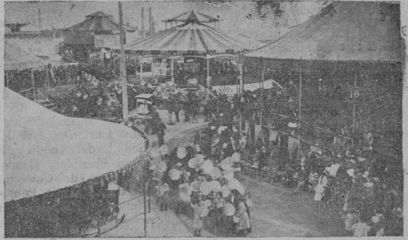
Un aspecto del parque de atracciones de la Feria de Ramos

Régimen transitorio.—Establecido por la ley un régimen esencialmente distinto al anterior, se hacía indispensable arbitrar un cauce transitivo para que con rapidez y eficacia pudiesen adaptarse a aquél los arriendos vigentes en la actualidad. A tal fin se declaran sometidos a la nueva ley los que se hallen inscritos en el Registro de la Propiedad, los que el arrendador y arrendatario convengan de mutuo acuerdo acoger al régimen de aquélla, y finalmente aquellos otros en que el arrendatario lo solicite, adicionando al contrato antiguo los requisitos necesari-