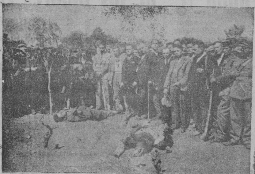
Los dos pistoleros que fueron perseguidos y muertos por los somatenistas de Tarragona