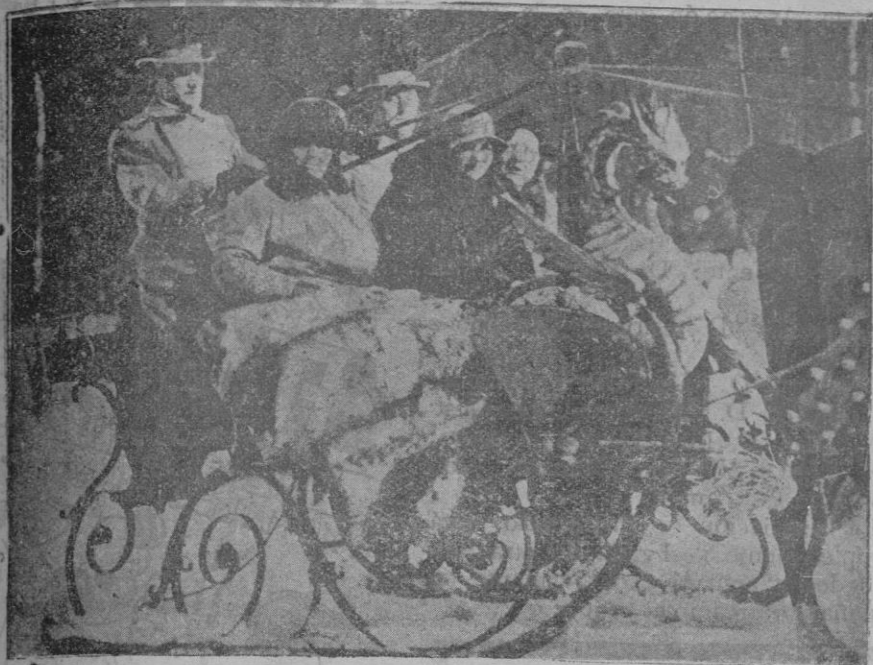
La reina de Holanda con su hija la princesa Juanita, paseando en trineo