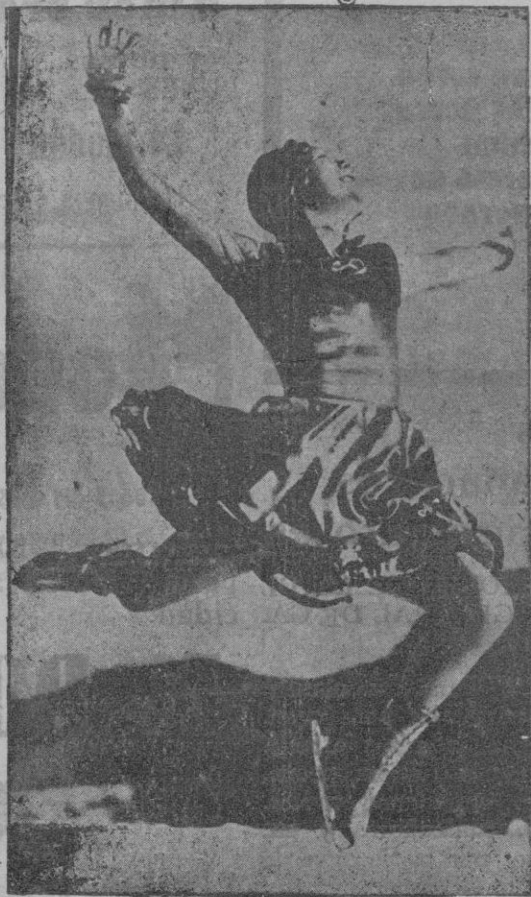
Saint Moritz.—La famosa patinadora Sonja Henie, patinando en las pistas heladas de esta estación invernal