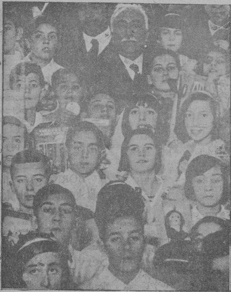
La fiesta del domingo celebrada en el Teatro Balear obra fué del Presidente de la República que dedicó importante donativo para juguetes para los niños. No fué sólo en Palma donde los niños recibieron la alegría del juguete tradicional, sino que en Madrid también se repartieron juguetes donados por el Presidente de la República a cuya repartición asistió el Sr. Alcalá Zamora que aparece en la fotografía rodeado de los niños favorecidos