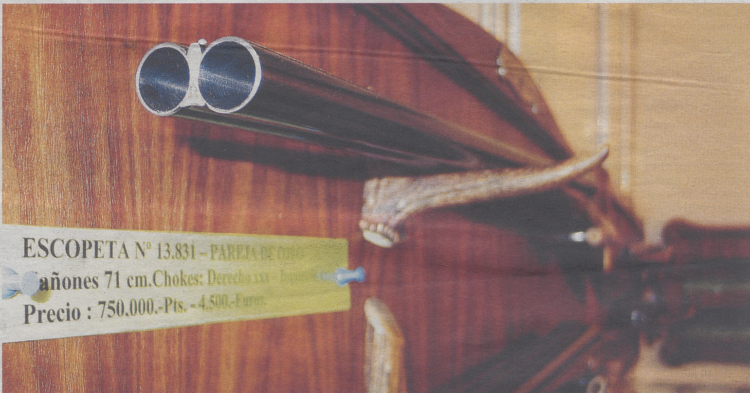
En los expositores se pudieron contemplar (y algunos adquirir) bonitas y caras armas, como esta paralela.