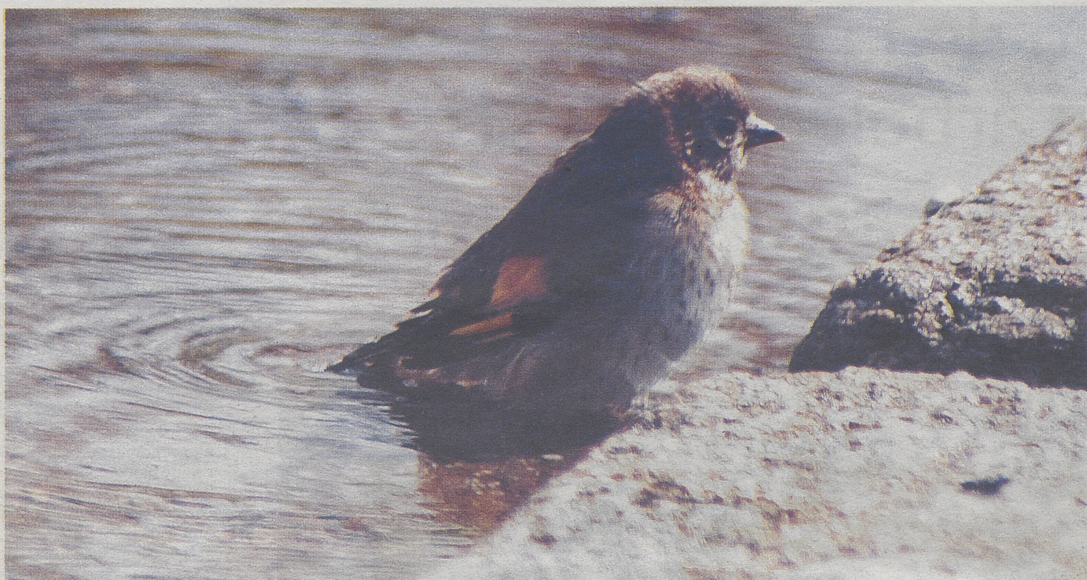
Jilguero ( Carduelis carduelis ) inmaduro; abajo, adulto. / VICENTE GARCÍA