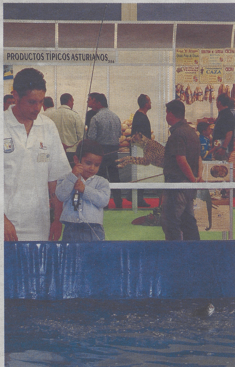
Muchos niños pudieron tener, por primera vez, una trucha clavada.

te campo a nivel nacional, ya que posee 9 de los 10 primeros trofeos de macho montés, 8 de los de corzo, siete de los de rebeco y los diez mayores trofeos de lobo del país.