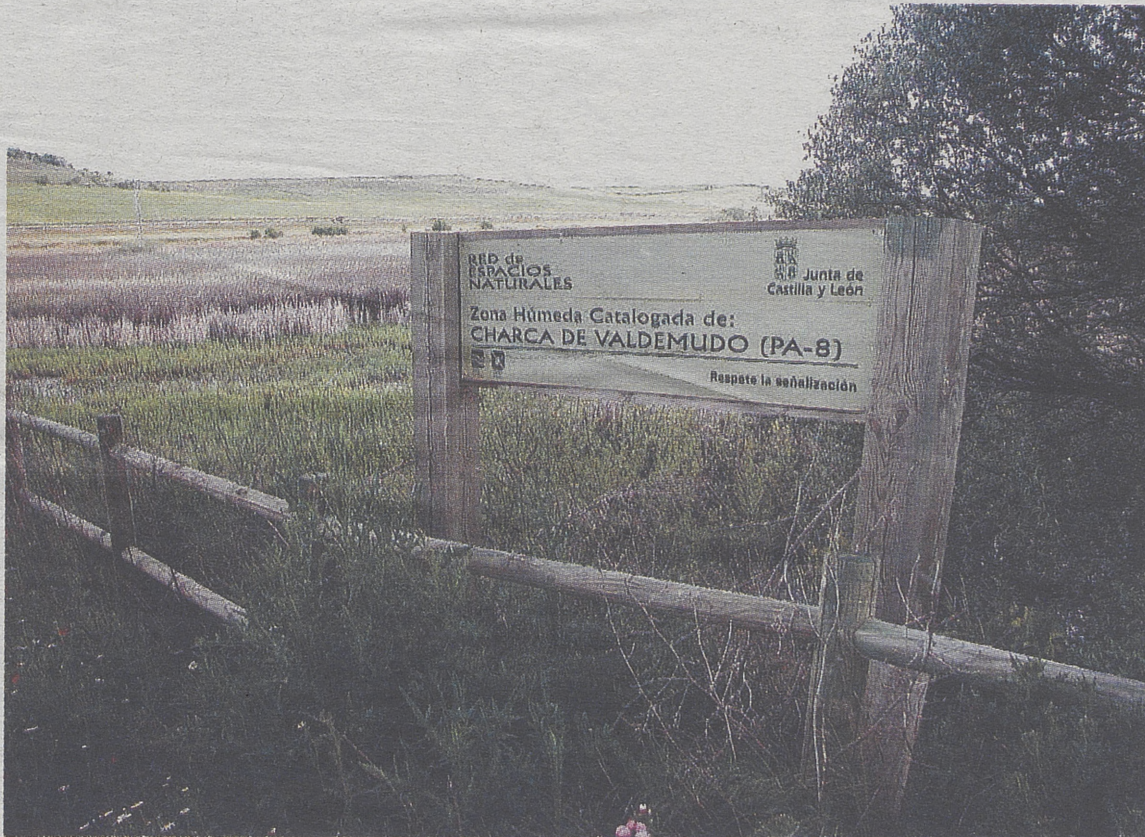
Charca de Valdemudo, en Palencia.

Las 35 lagunas se reparten en más de 80 kilómetros lineales, en los ramales Norte y de Campos, en la provincia de Palencia, con límites al Norte en Cabañas de Castilla y al Sur en Belmonte de Campos. Desde el punto de vista biológico, estos humedales se caracterizan por acoger unas interesantes formaciones de vegetación acuática, algunas de ellas casi únicas en el contexto de la Península Ibérica, que a su vez soportan también unas interesantes poblaciones animales, como puede ser el caso