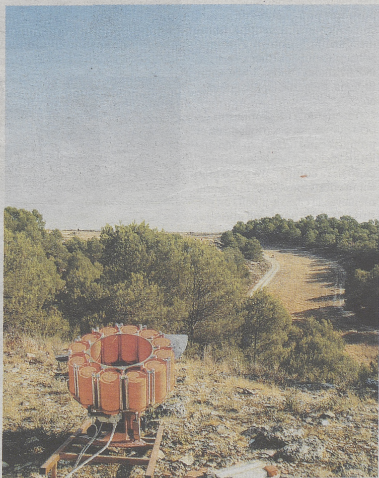
Los platos trataban de imitar las trayectorias de diferentes especies cinegéticas.