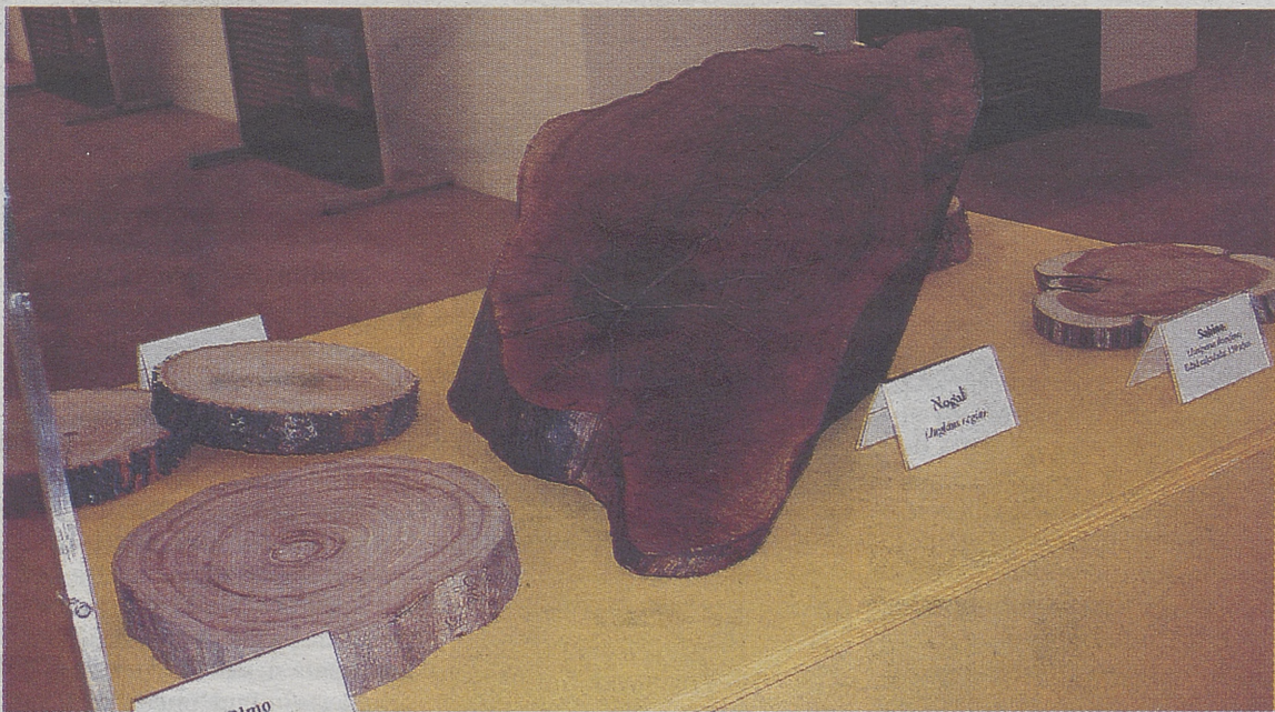
Algunos de los troncos que se pueden admirar.

Al frente del trabajo han estado Susana Domínguez-Lerena, directora del proyecto, y Ezequiel Martínez, fotógrafo que han recorrido más de 300.000 kilómetros a lo largo del territorio español buscando las mejores historias e imágenes de los árboles nacionales.