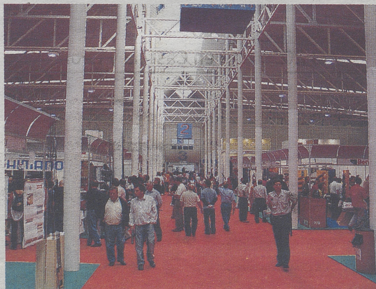
Aspecto del pabellón durante la jornada del sábado.