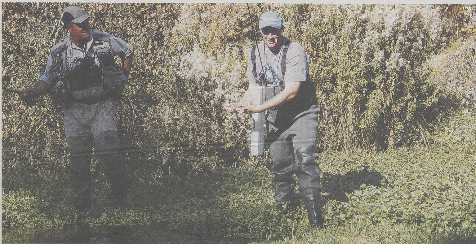
El juez nos muestra una de las truchas capturadas antes de devolverla al río. Esta sí dio la talla.

A lo largo del domingo se realizaron los actos de entrega de premios en las pruebas; por la mañana tuvieron lugar las de pesca, con el VI Encuentro Ibérico de Salmónidos Mosca, V Encuentro Latino de Bass y la II Eurobass Cup. Por la tarde, el escenario instalado en el pabellón 2 de la Semana Ibérica acogió las entregas de premios de las pruebas de caza: San Huberto y Recorridos de Caza.