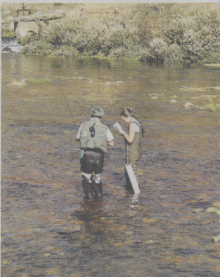
Anotando una de las capturas.