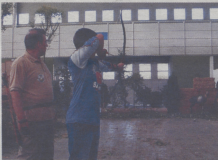
Hubo exhibiciones, pero el público también pudo participar.