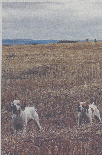
Bella muestra de dos pointers./M.H.

Durante las 15 horas lectivas teórico-prácticas que les serán impartidas a quienes se inscriban (630.88.66.47, 620.82.79.15 o avilacazadelg@hotmail.com ), se abordarán temas de relevancia como las reintroducciones, el control genético y sanitario de las especies cinegéticas, el control de predadores, el seguimiento de las poblaciones, el fomento y puesta en valor de la actividad de la caza o las armas de caza.