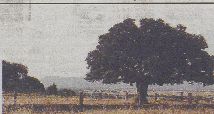
Un ejemplar de encina.

El 19,8% de los árboles escogidos como leyendas vivas se encuentran en la comunidad de Castilla y León. Exactamente son 708 de los 3.573 que componen el listado total. Si nos detenemos a analizar este dato por provincias, la que más árboles de estos tiene es la de León, con 116, seguida de Burgos que tienen 115. Valladolid es la que menos ejemplares aporta a esta selección, con sólo 30 ejemplares. El resto de las provincias varían el número de ejemplares: Soria (113), Segovia (109), Salamanca (73), Ávila (60), Palencia (49), y Zamora (43).