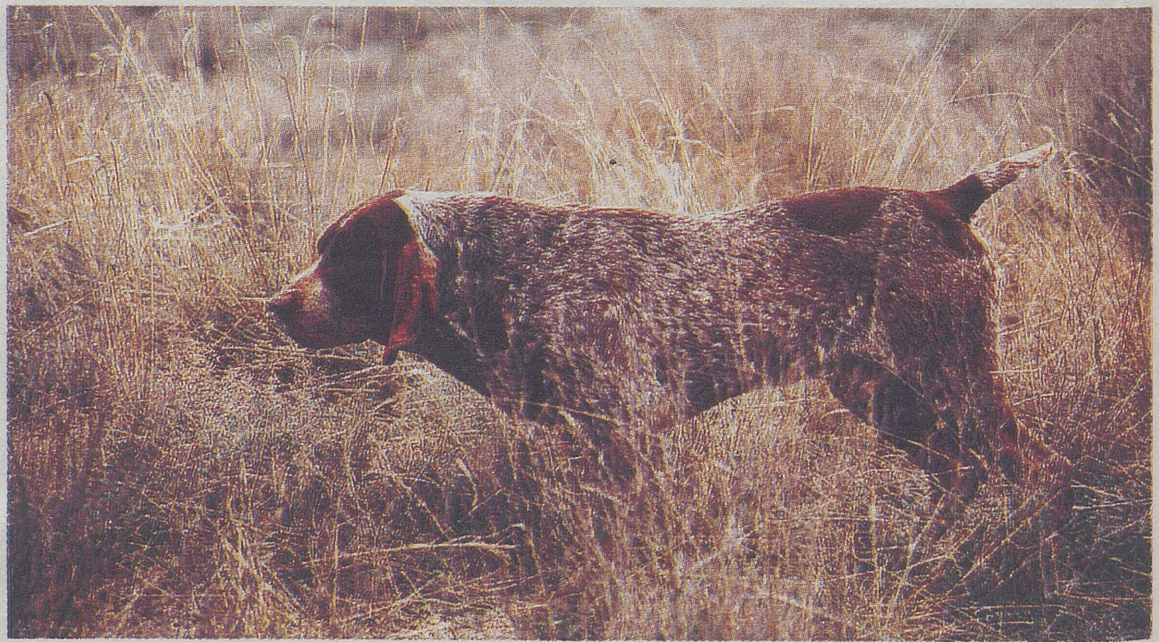
La prueba se realizará sobre caza sembrada.

Llevará el título 'El Perdiguero de Burgos: pasado, presente y futuro', y se analizará la evolución de la población de la raza a lo largo de la historia y la proyección de futuro de cara al cazador y los nuevos tiempos, a través de la proyección de una colección fotográfica