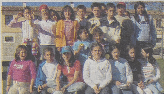
►COLEGIO JUAN LUIS VIVES Sotillo de la Adrada

Una leyenda de Sotillo de la Adrada. Sucedió en el año 1920. Dicen los mayores del pueblo que un terrible incendio asolaba la sierra de la localidad, sin que hubiera forma humana de pararlo. Desesperados, los vecinos acudieron a su Santa Patrona y la sacaron en procesión, y, justo en ese instante, una nube se fue posando sobre la montaña y descargó agua suficiente para controlar el incendio.