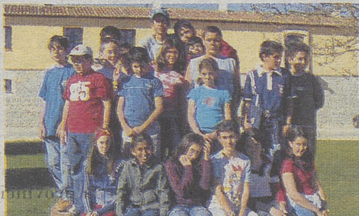
►COLEGIO JUAN LUIS VIVES Sotillo de la Adrada

Una leyenda de Sotillo de la Adrada. Sucedió en el año 1920. Dicen los mayores del pueblo que un terrible incendio asolaba la sierra de la localidad, sin que hubiera forma humana de pararlo. Desesperados, los vecinos acudieron a su Santa Patrona y la sacaron en procesión, y, justo en ese instante, una nube se fue posando sobre la montaña y descargó agua suficiente para controlar el incendio.