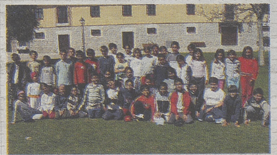
►COLEGIO MORENO ESPINOSA Cebreros

El casco urbano de Sotillo de la Adrada, debido a su espectacular expansión física en los últimos años, ha conservado escasas muestras de sus antiguas características; aun así, se pueden contemplar algunos elementos de interés: la iglesia del s. XV, la ermita de Nuestra Señora. De los Remedios, la Casa de la Cultura, la fuente de los Cinco Caños o las balconadas típicas de los s. XVIII y XIX en la calle Las Parras y calle Larga.