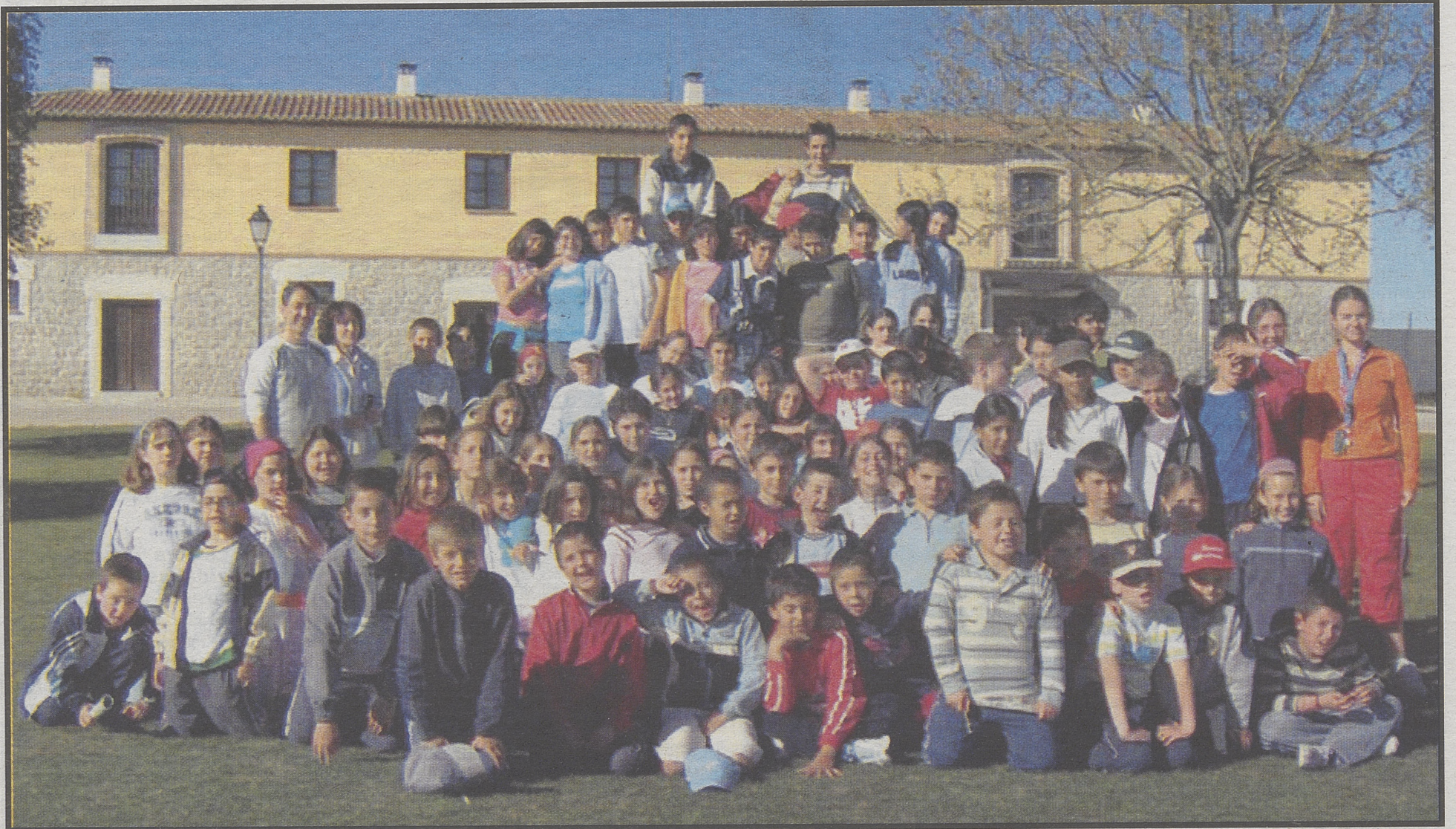
Alumnos del colegio Moreno Espinosa, de Cebreros, y del colegio JuanLuis Vives, de Sotillo.