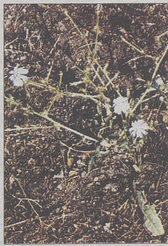
Cicorino, (verdura muy apreciada, propia de la primavera).

L a achicoria, es una especie de verdura que pertenece a la familia de las Compuestas, con más de un millar de géneros. Esta familia se caracteriza porque sus flores están compuestas por la fusión de cientos e incluso miles de flores diminutas. Puedes encontrarla en prados y cunetas, florece entre junio y septiembre, aunque la raíz se recolecta en otoño. Variedades: La achicoria es una planta medicinal de la que se usa todo. Tenemos: Achicoria de raíz, (café de achicoria), Achicoria de ensalada, (se consume principalmente como verdura), Achicoria de hojas, (rica en intibina),