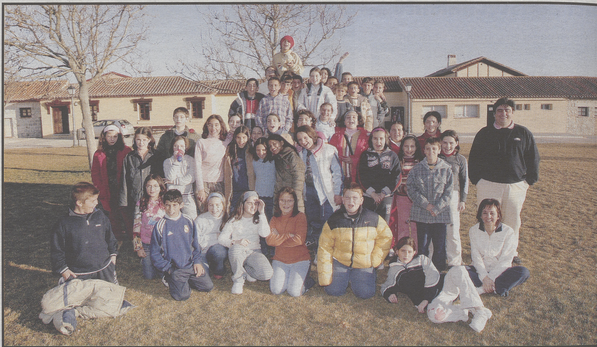
Alumnos del CRA Tierra de Arévalo, de Aldeaseca y Barromán, y del colegio público Santa Teresa de Jesús, de El Barraco.