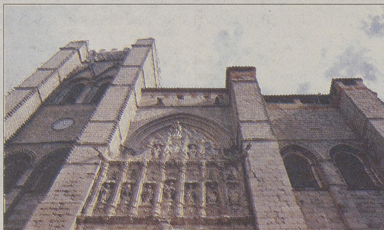
Detalle de la Catedral de Ávila. / ANTONIO BARTOLOMÉ

La muestra de arte sacro 'Testigos' es una exposición excelente que no puede tener mejor valoración »»