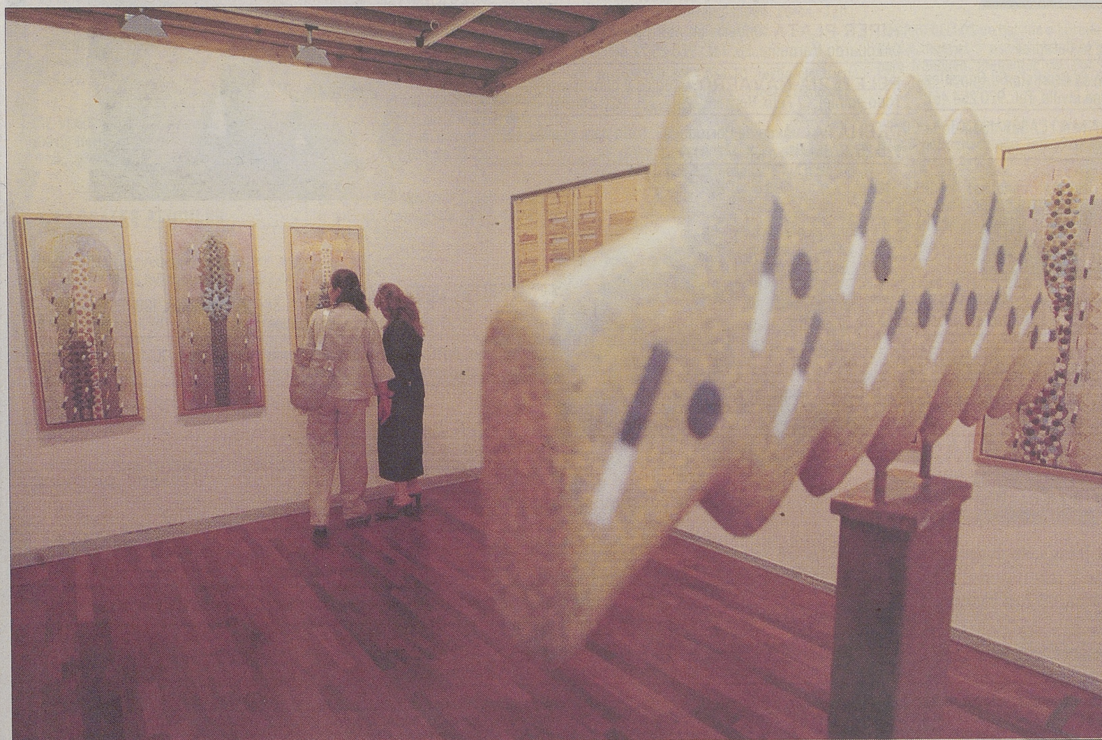
Dos visitantes de la muestra de Jesús Velayos en el Palacio de los Serrano observan uno de los cuadros que han formado parte de la misma.