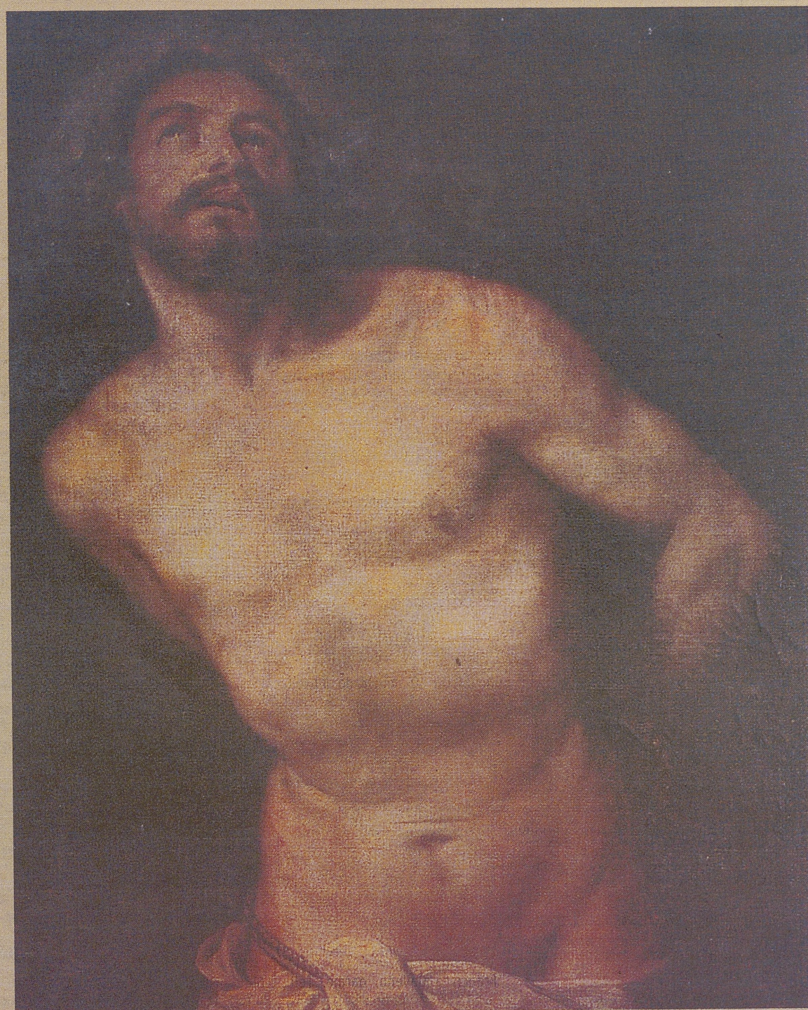
Detalle del lienzo 'Jesús amarrado a la columna', de Alonso Cano.

visitaron 'Testigos' durante las once primeras semanas