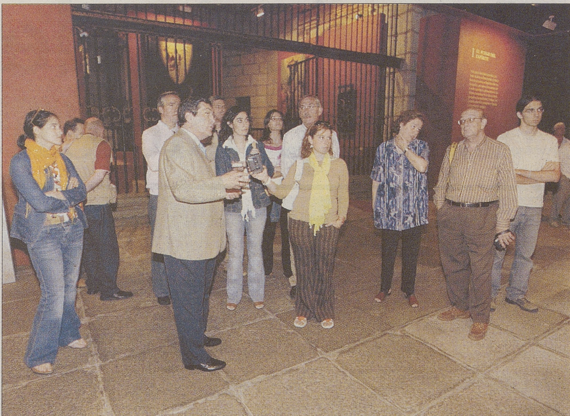
Los periodistas de Palencia atienden las explicaciones del comisario de 'Testigos' en la primera parte de la exposición.

Aunque la tierra tira mucho, los informadores coincidieron en afirmar que «la exposición de Ávila está muy bien, junto con la de Palencia -que se celebró en 1999-», aseguraba la informadora de Diario Palentino quien compartió visita con periodistas