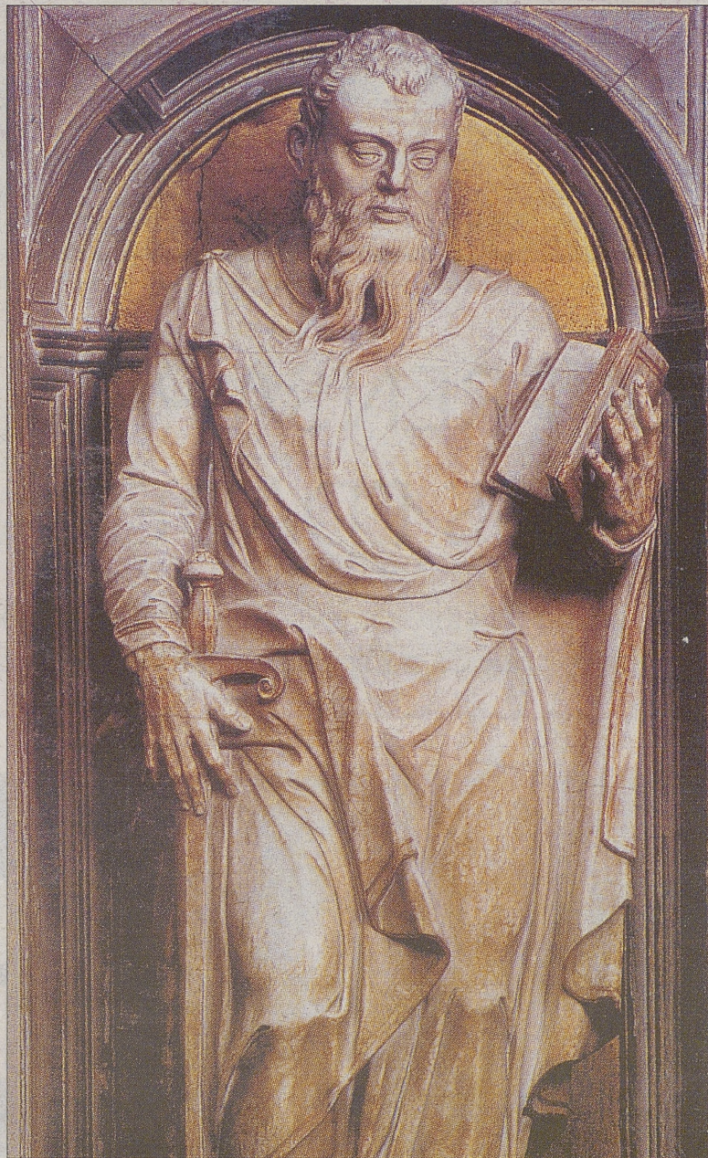
'San Pablo', una escultura de 1575, obra de Juan Sánchez.

en un contexto alejado de una ubicación original que podría parecer extraña ya que la iglesia está dedicada a San Pedro. «La elección de San Pablo como imagen titular de un retablo situado en un lugar preferente de esta iglesia, se explica por el hecho de que el santo aparece siempre relacionado en el arte cristiano con San Pedro, pues se les considera a ambos los Príncipes de la Iglesia, por su función de creadores del Cristianismo». De hecho, la utilización de un material noble como el alabastro, sin recurrir a la madera -utilizada, pintada en blanco, para los retablos- responde «al deseo de la parroquia de crear una obra que reuniera las condiciones de mayor perdurabilidad y de mayor belleza posibles, al mismo tiempo que enlazaba con la tradición abulense de usar este material para la imaginería religiosa». Belleza, desde luego, no le falta.