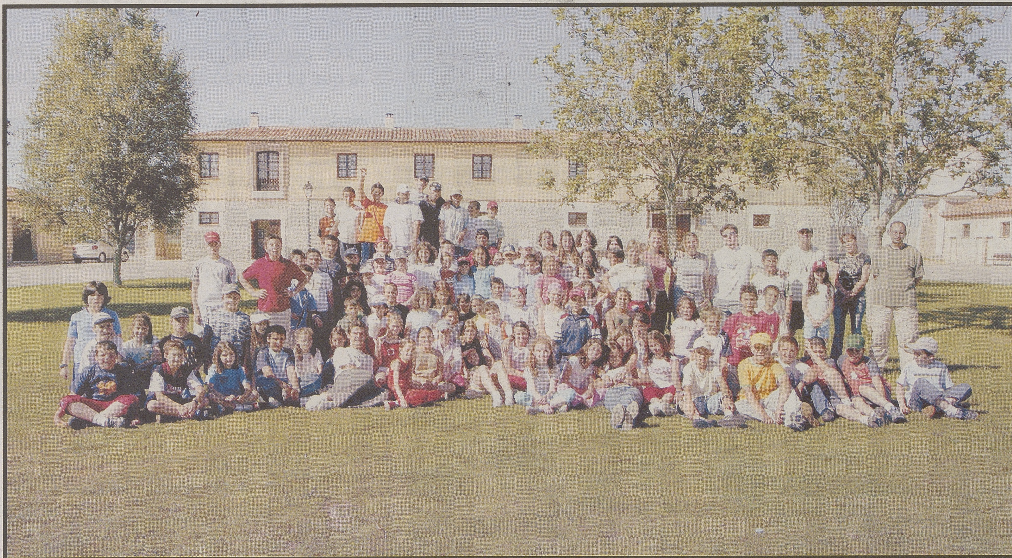
Alumnos del colegio público Las Rubieras, de Navaluenga, y de los C. R. A. Alto Gredos y Alto Alberche.