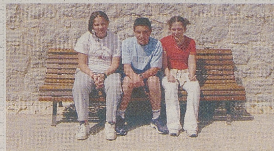
►C. R. A. ALTO GREDOS / HOYOS DEL ESPINO El Castillo

Hace muchos años vino un moro a Navarredonda. Como no sabía nada de este pueblo, los navarretos le dijeron que en la laguna de Gredos había una sirena que hipnotizaba a los hombres con su canto. El hombre muy curioso subió a la laguna para comprobarlo. Como los de Navarredonda no querían que se enfadase, subieron antes que él y con unos objetos se pusieron a hacer ruido; el moro del susto se murió y la sirena emergió de las profundidades y se llevó el alma del moro. Por eso ahora el pico más alto de Gredos se llama como el apellido de aquel hombre Almanzor.