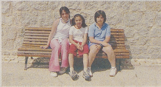
►C. R. A. ALTO GREDOS / NAVARREDONDA El Moro Almanzor

Hace mucho tiempo el puente de nuestro pueblo dividía a un lado a los cristianos y al otro lado a los moros. Un cristiano se enamoró de una mora y para poderse ver pasaban de un lado a otro en una barca. Un día cuando la mora estaba bordando un paño para su amado, bajó una manada de lobos y se la llevaron. Los moros creyeron que los cristianos la habían secuestrado y entraron en guerra. Al tiempo, un pastor se encontró un ovillo de hilo, lo siguió y se encontró a la mora muerta. Por eso se dice que se construyó el puente para unir a los dos pueblos. En memoria de la mora se encuentra una piedra dedicada en el pilar central del puente.