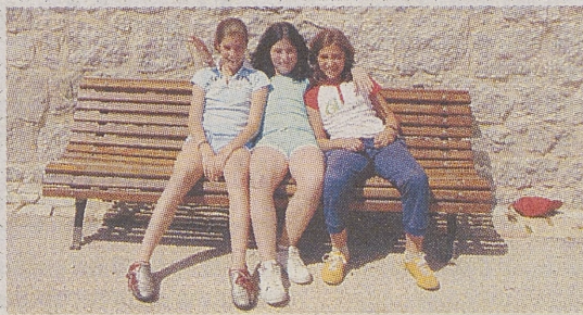
►C. P. LAS RUBIERAS/ NAVALUENGA La cueva de la mora

Hace mucho tiempo el puente de nuestro pueblo dividía a un lado a los cristianos y al otro lado a los moros. Un cristiano se enamoró de una mora y para poderse ver pasaban de un lado a otro en una barca. Un día cuando la mora estaba bordando un paño para su amado, bajó una manada de lobos y se la llevaron. Los moros creyeron que los cristianos la habían secuestrado y entraron en guerra. Al tiempo, un pastor se encontró un ovillo de hilo, lo siguió y se encontró a la mora muerta. Por eso se dice que se construyó el puente para unir a los dos pueblos. En memoria de la mora se encuentra una piedra dedicada en el pilar central del puente.