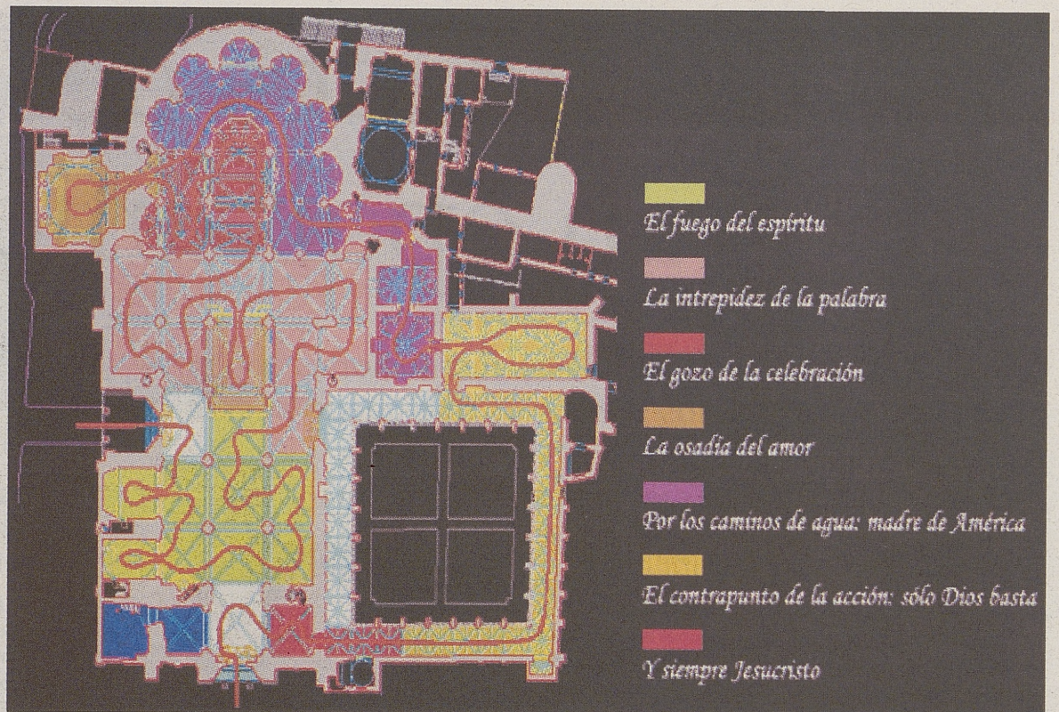
Plano de la Catedral de Ávila con el recorrido que se efectúa por los distintos capítulos de 'Testigos'.

El recorrido culmina con el séptimo capítulo, Y siempre, Jesucristo , un compendio de once piezas donde se encuentra un Pantocrátor del siglo XII, de la localidad palentina de Quintanadueñas, o un Cristo Salvador , anónimo del siglo XVI del convento de las Madres Cistercienses de Ávila.