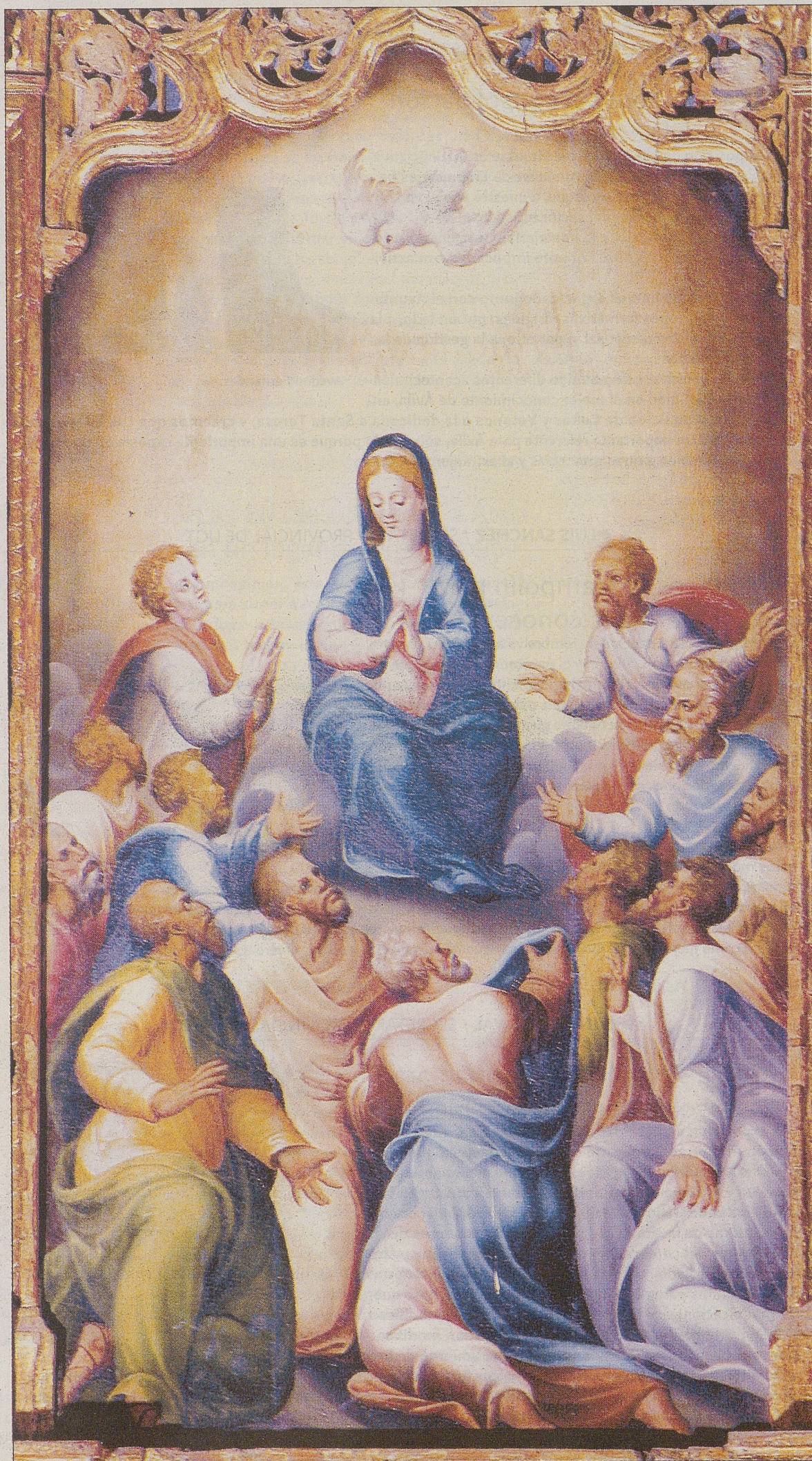
Pentecostés , de Diego Rosales, tabla del siglo XVI perteneciente al retablo mayor de la iglesia de Flores de Ávila.

Esta tabla se podrá contemplar en el primer capítulo de la exposición, denominado 'El fuego del Espíritu', y no cabe duda de que representa en toda su dimensión ese momento.