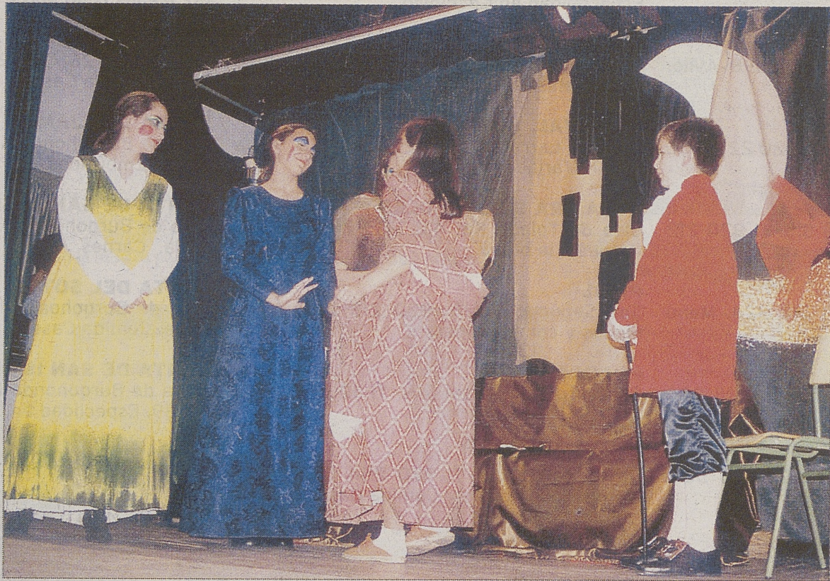
Actuación, el pasado año, de los alumnos del colegio Santa Teresa de Ávila.

por el grupo del colegio abulense Santa Ana. Se cerrará el certamen el viernes con la puesta en escena de Los mundos del Pelis , por el grupo del centro Rey Don Jaime de Alzira, y El juicio de Salomón , por el grupo del CRA Miguel Delibes de Mingorría.