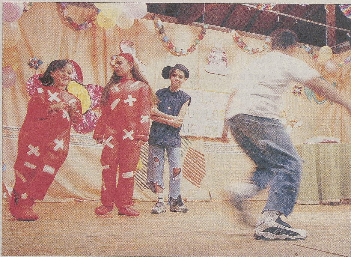
Actuación, el pasado año, del grupo Los Peques de San Viator.

El jueves se interpretarán las obras El cuadro embrujado , por el grupo Virgen Niña de Valladolid, y Edelmiro II y el dragón Guitérrez ,