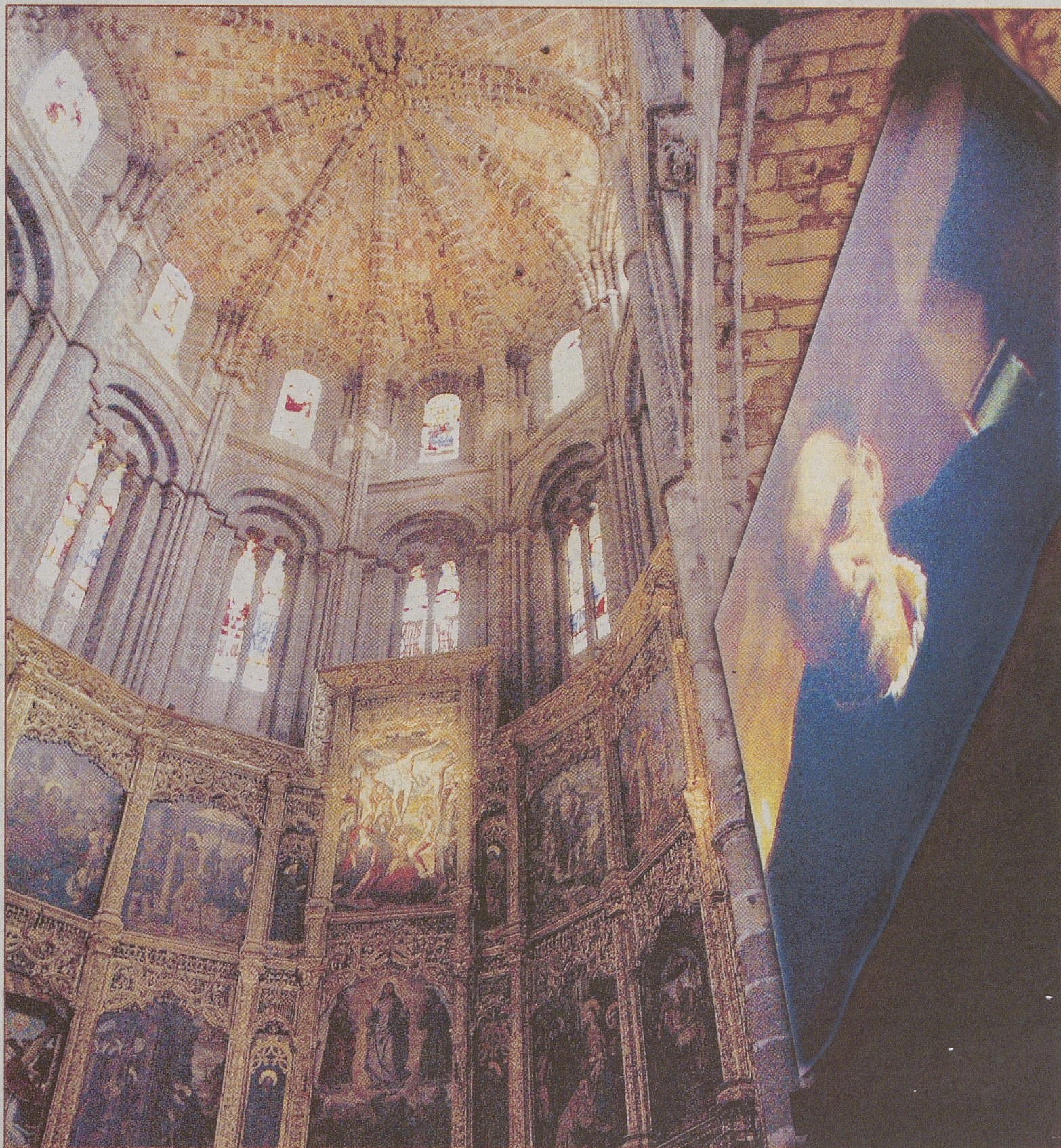
Retablo mayor de la Catedral de Ávila, donde se exhibe un audiovisual, a la derecha.