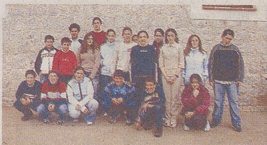
► C. R. A. LLANOS DE LA MORAÑA

En nuestro pueblo, hace poco tiempo, se comenzaron a hacer unas excavaciones en la ermita que hay detrás del cementerio, con la idea de ampliar el citado cementerio. Cuando comenzaron las excavaciones se encontraron restos de mosaicos, por esta razón han venido expertos para hacer las pruebas oportunas. Las investigaciones muestran que, en esta zona, podía encontrarse antiguamente una ciudad romana, pero, con el paso del tiempo, se ha derrumbado y enterrado bajo el suelo.