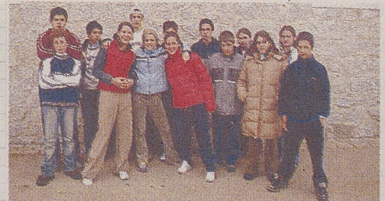
► C.R.A. ULACA / SOLOSANCHO

Todos los años realizamos una ruta ecológica con el fin de conocer y proteger mejor el medio que nos rodea. El curso anterior la ruta fue a 'los infiernos de Arevalillo' y la realizamos parte a pie y parte en bicicleta. Este entorno privilegiado se encuentra en un cañón de un barranco entre Villaflor y Horcajuelo, en un punto en el que comienza la Moraña y termina la Sierra de Ávila. Se trata de una zona muy erosionada por el agua en la que coinciden rocas de distintos colores, y las figuras originadas por la erosión son de una gran belleza.