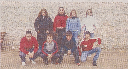
► C. R. A. LLANOS DE LA MORAÑA / SAN PEDRO DEL ARROYO