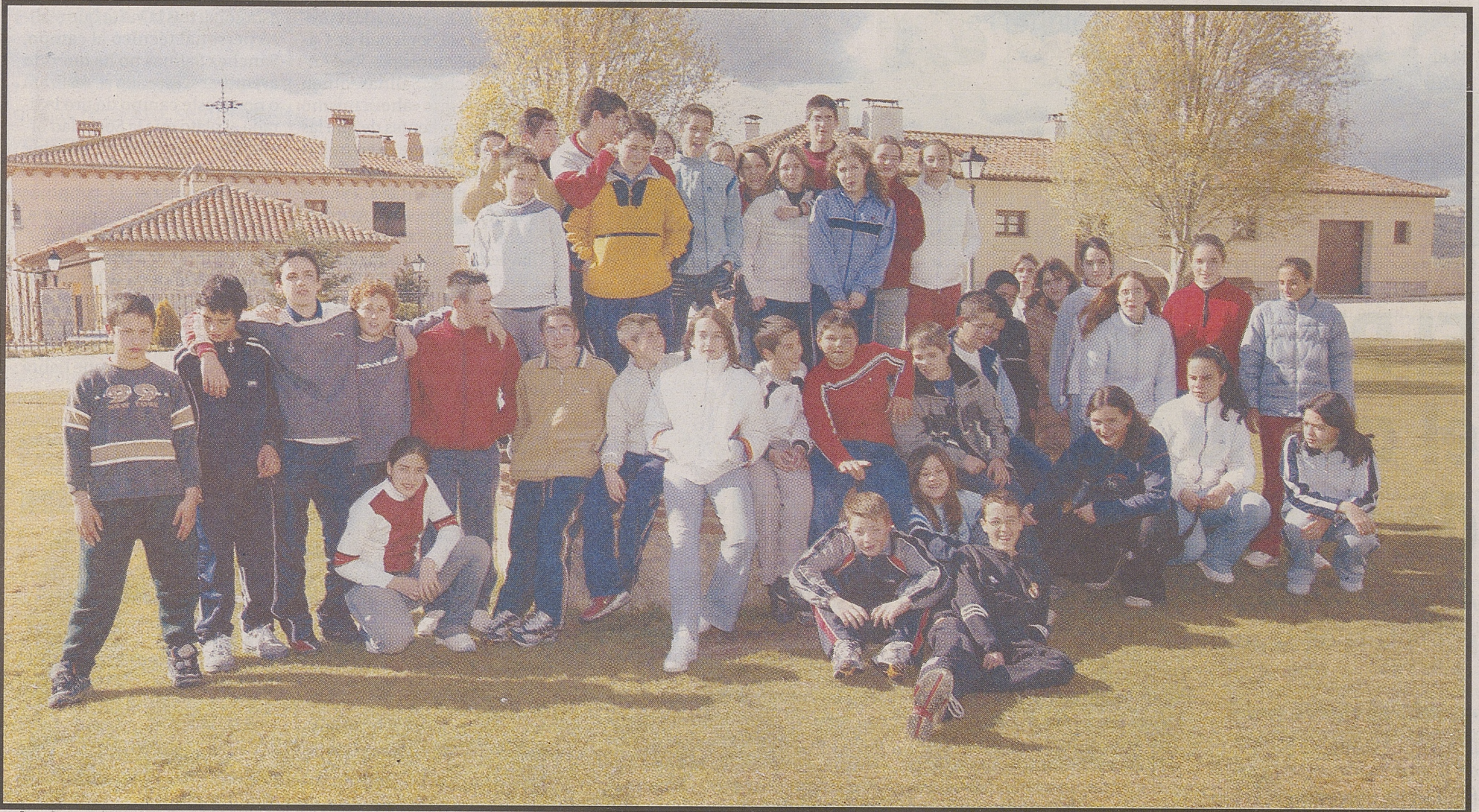
Alumnos del CRA Llanos de la Moraña (San Pedro del Arroyo) y de los CRA Ulaca (Solosancho). / Pablo Requejo