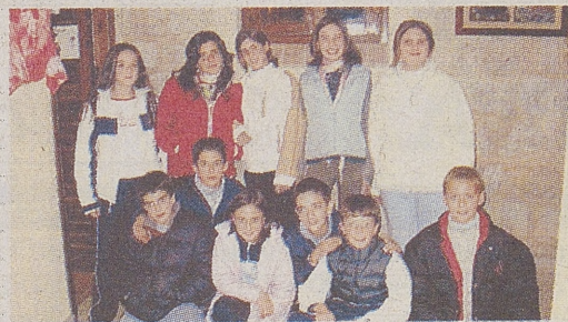
►C. P. DIVINA PASTORA / ARENAS «Leyenda de la lechuza»

Se trata de una leyenda ocurrida en el castillo de la Triste Condesa, construido por el Condestable Ruy López Dávalos entre 1395 y 1423. En 1393 el rey Enrique III de Castilla, concede real privilegio de villazgo a Arenas, La Villa, Candeleda y La Adrada. Con la carta de villazgo, Arenas conseguía como una pequeña autonomía, no tenía que pagar algunos impuestos. Pero dos años después el mismo rey hace señor de estas tierras al Condestable Dávalos. El Condestable Dávalos se casó con Juana de Pimentel llamada Triste Condesa, debido a su tristeza por la muerte de su marido.