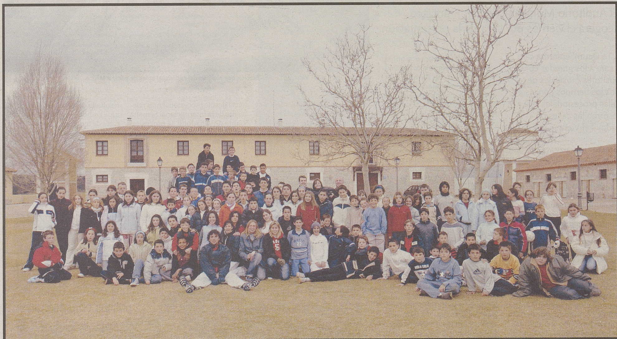
Alumnos de los colegios Divina Pastora (Arenas de San Pedro), San Juan de la Cruz (Piedralaves) y del Centro Rural Agrupado El Valle.