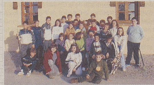
►C.R.A. EL VALLE / CUEVAS DEL VALLE «La pitarra»

Dice la leyenda que unos jóvenes cabreros de Piedralaves dormían en la sierra en un risco llamado La Graja. De repente se despertaron y oyeron alegres canciones. Vieron una gran lancha de piedra negra, en su base en un hermoso charco se bañaban unas jóvenes de extraordinaria belleza, eran las ninfas y hadas del bosque. Cuando se acercaron les dijeron: somos las protectoras de la naturaleza, cuidad de la sierra y sus animales y nosotras cuidaremos Piedralaves. Desde entonces en noches de luna negra se oyen en Lancha Negra las risas y canciones de las ninfas.