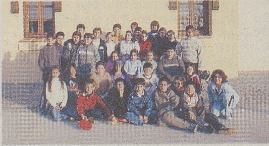
►C.P. SAN JUAN DE LA CRUZ / PIEDRALAVES «La leyenda de lancha negra»

Se trata de una leyenda ocurrida en el castillo de la Triste Condesa, construido por el Condestable Ruy López Dávalos entre 1395 y 1423. En 1393 el rey Enrique III de Castilla, concede real privilegio de villazgo a Arenas, La Villa, Candeleda y La Adrada. Con la carta de villazgo, Arenas conseguía como una pequeña autonomía, no tenía que pagar algunos impuestos. Pero dos años después el mismo rey hace señor de estas tierras al Condestable Dávalos. El Condestable Dávalos se casó con Juana de Pimentel llamada Triste Condesa, debido a su tristeza por la muerte de su marido.