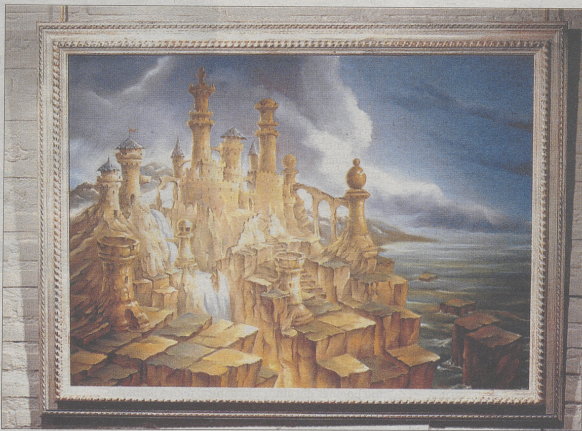
'Por un puñado de realidad' y 'Defensa siciliana', dos de las obras expuestas. / ENRIQUE LUIS