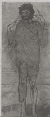
Cuadernos de La Perra Gorda

libre , el lector tiene ante sí la totalidad de la siembra. La puede contemplar plenamente fructificada. El poemario lo integran ocho partes. Ninguna de ellas dejará indiferente a quien se acerque a saborear los resultados.