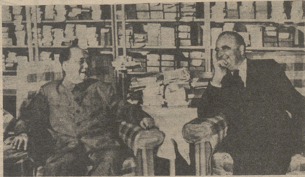
Continúa la expectación —objeto de los comentaristas en política exterior— en torno a la visita oficial que, actualmente, realiza a Pekín el presidente Pompidou, de la República Francesa quien, en la presente fotografía, de Europa Press, aparece conversando con el presidente del partido comunista y dictador de China, Mao Tse-Tung, quien le recibió en la Ciudad Prohibida.