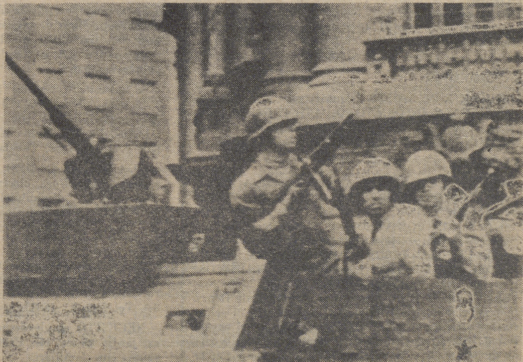
En las presentes imágenes, tropas del Ejército chileno, que efectuaron el ataque al Palacio presidencial de la Moneda —en el que, poco antes se suicidó el depuesto presidente Allende— el cual resultó destruido por el fuego.