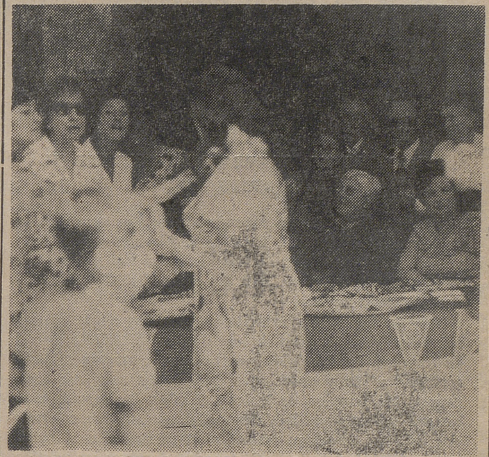
Coincidiendo con las tradicionales fiestas de Piedrahita, se ha celebrado, con notorio éxito la cuestación anual en favor de la Lucha contra el Cáncer, a la que se refiere la presente fotografía, obteniéndose una lucida recaudación.