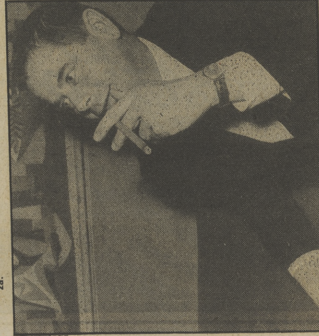
La «deliciosa» de chantaje a una mujer, con Glenn Ford, en «Sesión de noche»

• Recientemente se ha celebrado en Madrid el IV Festival Internacional de Teatro, que contempló diversos espectáculos de danza.