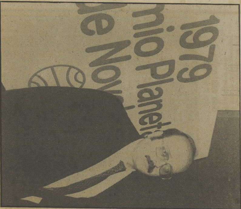
El autorretrato de Manuel Vázquez Montalbán