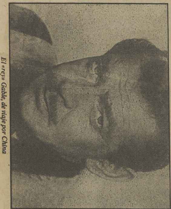
El "rey" Gable, de viaje por China

INTERPRETES: Clark Gable, Myrna Loy, Walter Pidgeon, Walter Connolly y Leo Carrillo.